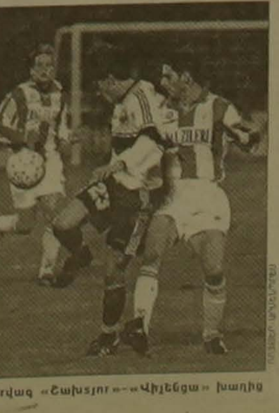
Դրվագ «Շախտյոր»-«Վիլյենգա» խաղից

տալիան մեկնելուց առաջ ծանր վիճակում հայտնվեցին։ Չեռնոսիայի ղեկավար ստացվեց Մոսկվայի «Լոկոմոտիվ» խաղը, միայն խաղադաշտում Չեռնոսիայի խիստ զուլը նվազագույն հաշվով հաղթանակ թերեց նրանց։ Առանձնացնեն նաև «Տրոստի» հաղթանակը «Չելսի» նկատմամբ, ինչպես նաև «Շեռնոսի» հյուրընկալվելիս սարած խոշոր հաղթանակը Իտալիան, մեզ հետաքրքրում էր նաև «Կոդենհագենի» ելույթը, որը նախորդ փուլում հաղթել էր երեսնի «Արարաին»։ Այս անգամ ըստիացիները թափարություն կրեցին, բայց դասաստիան խաղում հաջողություն կարող են ակնկալել։ Լոկոմոտիվ (Ռուսաստան)- Դոնեցկի (Չեռնոսիա) 2-1 Շախտյոր (Ուկրաինա)- Վիլյենգա (Իտալիա) 1-3 Տրոստ (Նորվեգիա)- Չելսի (Անգլիա) 3-2 Էրբերն (Քելդիա)- Շեռնոսի (Չեռնոսիա) 0-4 Քեկսի (Իտալիա)- Կոդենհագեն (Դանիա) 2-0 ԱԵԿ (Չեռնոսիա)- Շեռնոսի (Ավստրիա) 2-0 Լիցցա (Ֆրանսիա)- Սլավիա (Չեխիա) 2-2 Պրիմորյե (Սլովենիա)- Ռոդա (Գերմանիա) 0-2 Գավաթակիրների գավաթի 1/8-ի թափարական հանդիպումները տեղի կունենան նոյեմբերի 6-ին։