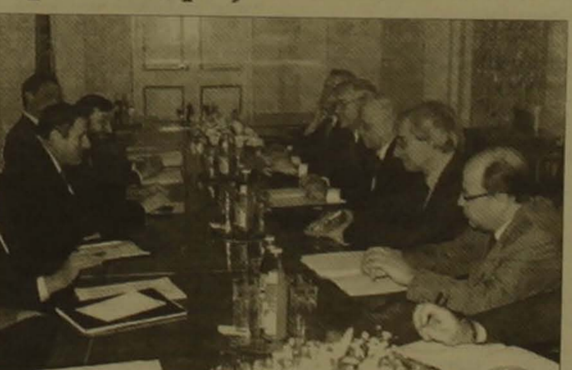
Լեւոն Տեր-Պետրոսյանը չի կրել որեւէ համանախագահները վերադառնալով Աստիանակերտից, կրկին հանդիպեցին 33 նախագահի հետ:

ԵԱԳՎ Մինսկի խմբի համանախագահների երջան կատարած այցը չէր լուրջ որեւէ լուրջ փոփոխություն չի արձանագրի բանակցային ընթացքում: Հասկալիքներ են նկատվում, որ ըստ արձանագրության մասնակի խոսակցության, առայժմ վաղաժամ է խոսել որեւէ փաստաթղթի մասին, որը կարող է հիմն հանդիսանալ բանակցային ընթացքի համար: Նրա ասելով, առայժմ ճշտվում են կարգավորման մեթոդաբանական սկզբունքները: Այն հարցին, թե համանախագահների այցը կարո՞ղ է խոչընդոտել Մինսկի խմբի բանակցային ընթացքի վերակսմանը, մասնակի խոսակցող նախագահները, թե որեւէ խոչընդոտչկա: Ինչ վերաբերում է Հայաստանի կողմից ԼՂՀ ճանաչմանը, ապա 33 ԱԳՆ-ի տեսակետը այս հարցում որե-