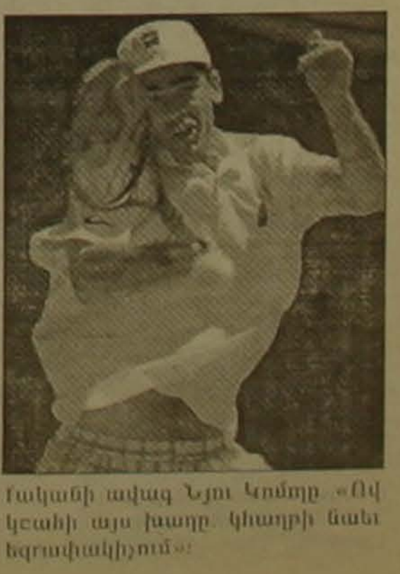
Իսկանի ավագ Նյու Կոմոյը «Ով կեանի այս խաղը կհաղթի նաև եզրափակիչում»:

Մասնագետները թեմայի աշխարհում իրարարժեքություն են համարում Գեիսի գավաթի խաղարկությունում առաջիկա հանդիպումը ԱՄՆ և Ավստրալիայի հավաքականների միջև: Հասկալիքն հետաքրքրություն է առաջացրել անհրկացի մեծ թեմայիսներ, մոլորակի համադասարանային արժեքը 1 և 2 ռակետներ Փիթ Սամվիլիսի և Մայլ Զանգի մրցամարտը Պասիկ Ռաֆիկ-Մարկ Ֆիլիպոսի գույցի դեմ: Ռաֆիկը վերջերս Երեսնամյա ԱՄՆ բաց առաջնությունը, իսկ Ֆիլիպոսիսը անող ասոցի: Երկու հավաքականների հնարավորությունը զուր գալու եզրափակիչ մոտավորապես հավասար է գնահատվում: Եվ ինչո՞րքան նկատեց Ավստրալիայի հավա