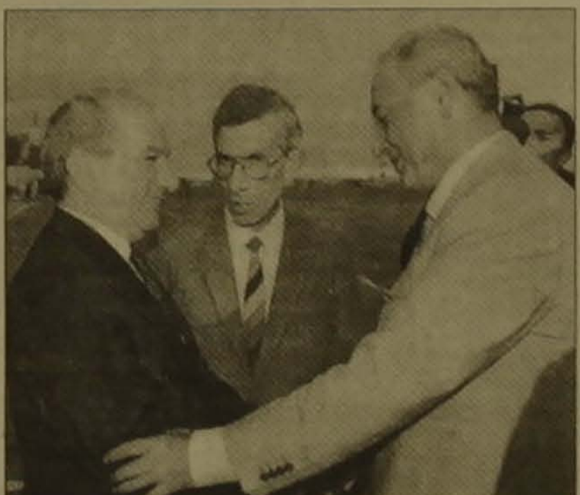
Նաբիհ Բրրիին և Բորիս Ելցինը Երեւանում: Նաբիհ Բրրիին և Բորիս Ելցինը Երեւանում: Նաբիհ Բրրիին և Բորիս Ելցինը Երեւանում:

ԵՐԵՎԱՆ, 12 ՍԵՊՏԵՄԲԵՐ, ԼՈՅՅԱՆ ՏԱՊԱՆ: Հայաստանի Ազգային ժողովի նախագահ Բորիս Ելցինը 12-ին դաժնանկան այցով Երեւան ժամանեց Լիբանանի Հանրապետության խորհրդարանի նախագահ Նաբիհ Բրրիին: «Ինձ համար մեծ դասիվ է այցելել Հայաստան, որի առաջին ափսոսանքն է ներկայացել: Ես լավ եմ ծանոթանալու հայ ժողովրդին, այն ժողովրդին, որին համարում եմ իմ լիբանանցի ժողովրդի մի մասը նաև»: Ելցինը հետևեց Լիբանանի նախագահի և վարչապետի հետ հանդիպումների: Նա ընդգծեց, որ Լիբանանը կառուցվել է ներկայումս էլ կառուցվում է իր երկրում բնակվող հայ ժողովրդի ներկայացուցիչների մասնակցությամբ: Հի Ելցինը ներկայացրեց իր ժողովրդի միջին զորություն ունեցող դասական կառույցը Լիբանանի խոշորագույն նախագահը հույս հայտնեց, որ այս երկրները կարողանան խոստովանել իր ժողովրդի ներկայացուցիչներին: