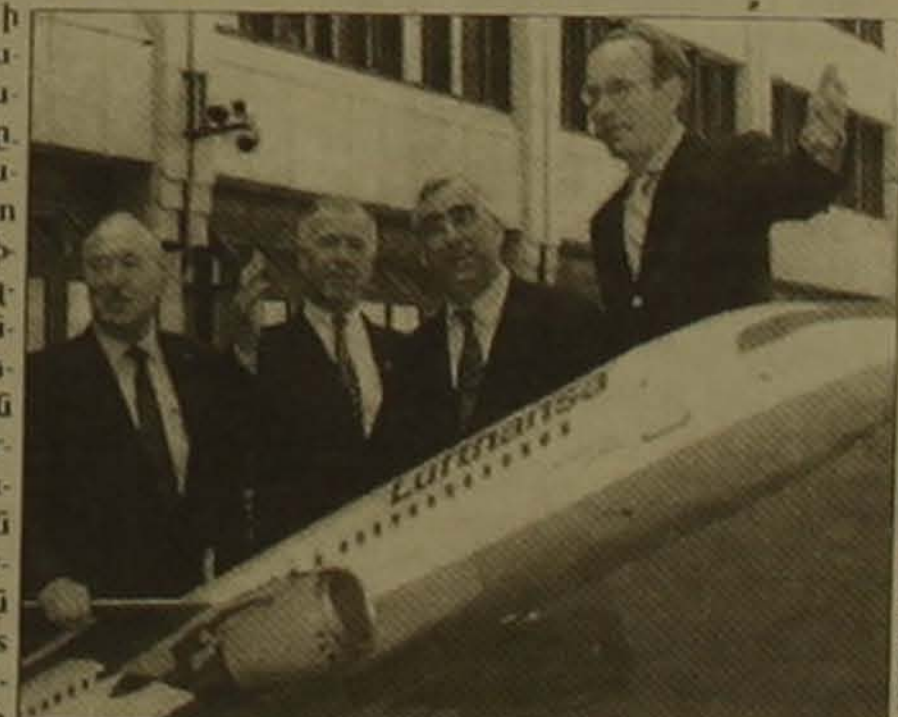
Գերմանիայի Տրանսպորտի նախարար Մարիա Կլաուսը, ֆինանսների նախարար Թեո Կայզերը, «Լուֆթհանզա» ազգային ավիաընկերության անհանդես Յուրգեն Վեբերը և գերմանական կառավարության վարկային գործակալության խոսնակ Գերս Վոզը մանրակրկիտ օդանավի առջև, մամլո ասուլիսից հետո, որի ընթացքում «Կայզերը հայտարարեց, որ ավիաընկերության սեփականաձեռնարկումը դեղերից միայն այս արի կրքերի միլիարդ մարկի հավելյալ եկամուտ: