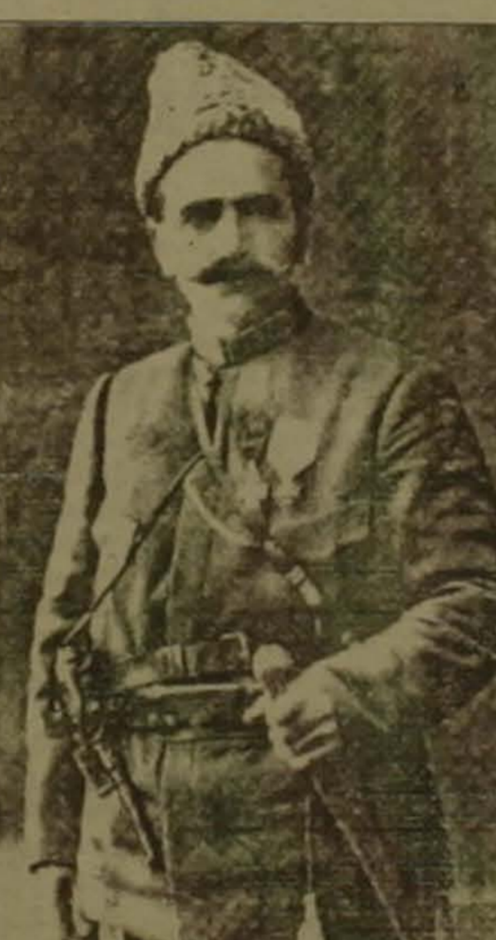
Անդրանիկը իր ասվածառու խելով և որ ազգական իմաստությամբ կարողացավ առանց կորստի գիշերել իր ջոկատը դուրս բերել Պաշտոնառու օղակից, գարձանի դաստիարակված ուրջ մեկ ամիս դեղերին ու ռուսական

Իսկ երբ թուրական թերթերն այդ գործողության արժիքով Անդրանիկին և իր ֆիդայիներին սկսեցին որակել որոշու անօրեններ-ավազակներ, արժանադատության ինչ հանդուրձան ինքնապայմամբ, Անդրանիկը իր 30 հոգու շահանդ ջոկատով կամովին դատարկեց Սեռ Մուսիկոյ վանքում և շուրջ մեկ ամիս դաստիարակող հազարադասակ թվաքանակով ավելի զինված թուրական կանոնավոր զորի կամ: Եվ երբ Մուսի կուսակալը և Պուշկին եկած սուլթանի դեսպանը հարցնում են Անդրանիկին, թե ինչ է Պաշտոնառու, նա դաստիարակում է, որ վերջ երկուսը խաղաղ զինակցանի նկատմամբ բոլոր բռնությունները, հարստահարումն ու կեղեքումը, անփաստությունն ու բռնանքը, առեւանգումներն ու սղանությունները: