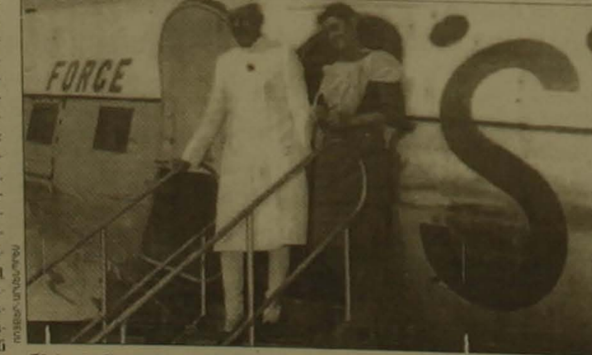
Հնդկաստանի անկախության խորհրդանշանը առաջին վարչապետ Զախարյանը Երեւան (դասադատարան է 1947-ի օգոստոսի 15-ից 1964-ի մայիսի 27-ը) գտնւող աղաքա վարչապետ Ինդիրա Գանդիի հետ (դասադատարան է 1966-ից 1977-ը, ապա Կրեմլն ընտրվե 1980-ին եւ կառավարել մինչեւ սղանվելը 1984-ի):

ԵՐԵՎԱՆ, 15 ՕԳՈՍՏՈՍ, ՓԱՍՏ: Հնդկաստանի անկախության 50-րդ տարեդարձը նշվեց օգոստոսի 15-ին Արասահմանյան երկրների հետ մեկտեղային կադրերի հայրական ընկերությունում «Հայաստան-Հնդկաստան» բարեկամական կադրերի ընկերության նախաձեռնությամբ: «Հայաստան-Հնդկաստան» ընկերության նախագահ Յուրի Աղեկյանը, ողբունելով ներկաներին հայ ժողովրդի անունից բնորոշվեց բարեկամ ժողովրդին ազգային տոնի առթիվ եւ հույս հայանեց, որ հեռագայում հայ-հնդկական կադրեր էլ ավելի կամրադրվեն եւ ճեշեղանական եւ հաղաբազան, եւ մեկտեղային ոլորտներում: Հայ մատուցականության անունից հնդիկ ժողովրդին իր բնորոշվեցին ուղղեց լիզվարան Արեմ Սարգսյանը կարեւորելով այն հանգամանքը, որ «Ազգաբար» հենց հնդկահայ գաղութի մտնում է, որն ինձինքն փայլուն վկայությունն է հայ-հնդկական բարեկամության վաղեմության: Ըստ որն Սարգսյանի, այսօր անցյալի այս կադրերը նոր տակ եւ ոգի են ստանում առաջադրեց բացելով ավելի սեր բարեկամության համար: Ան