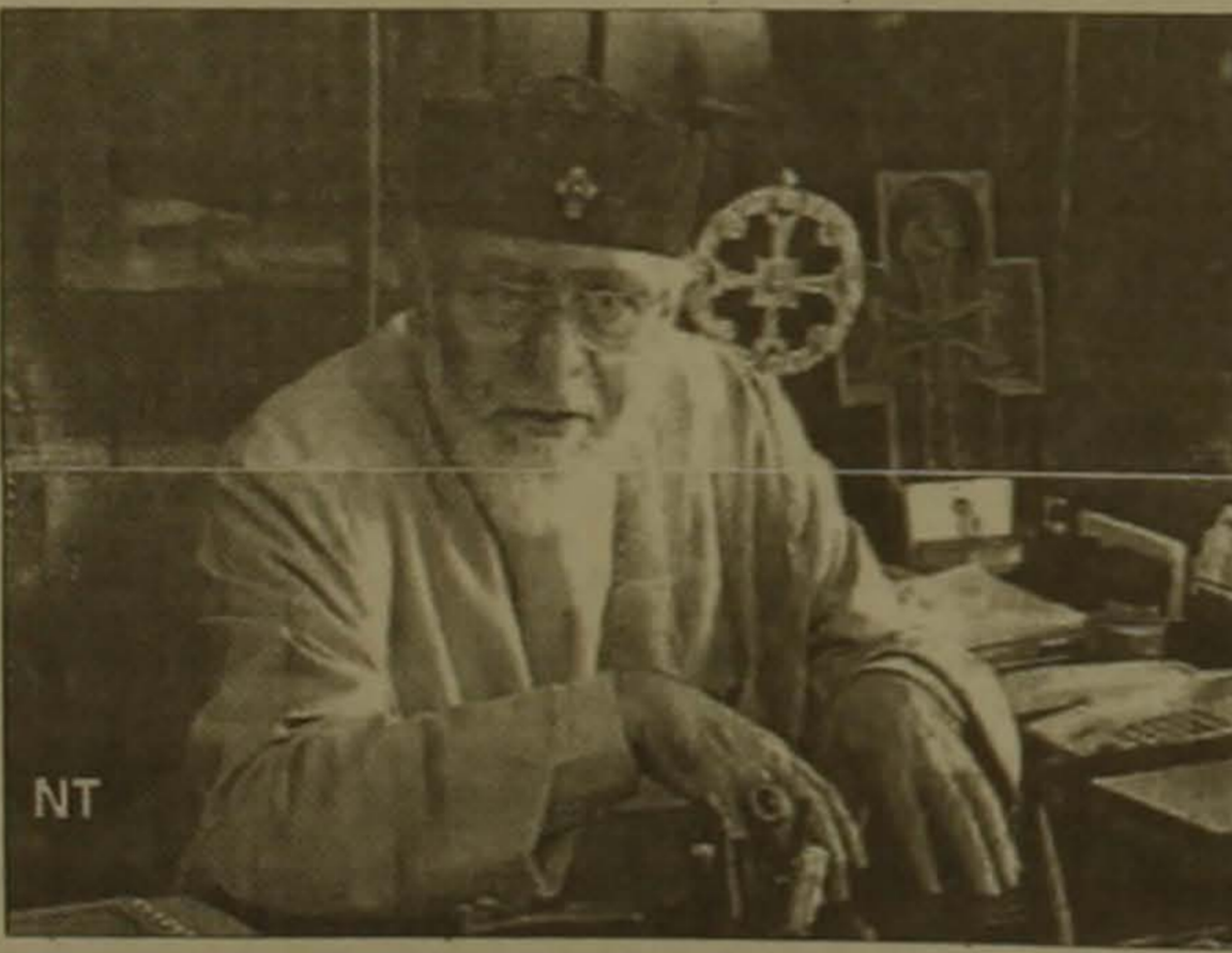
Ն.Ս.Օ.Տ.Տ Ամենայնի հայոց կաթողիկոս Գարեգին Ա

Այս հարցում, մասնավորաբար վերջերս, շեշտված մեակություններ կան: Բողոքական եկեղեցիները, որոնք տիրապետող հանգամանք ունեն եկեղեցիների համաբարհային խորհրդում, ընկալում են նկատում արդիապատեց գաղափարներ, որոնք երբեք եկեղեցու ավանդության մեջ չեն ունեցել եւ չունեն. օրինակ կանանց ֆահանայական ձեռնարկությունը եւ կամ ուրիշ քարտյական հարցեր, որոնք բխսոնեական հայեցողությամբ դասադարձվում են իբրեւ մեղք: Օրրոդոս եկեղեցիները շատ են վախենում, որ այդ արդիապատեց եւ բխսոնեական քարտյականն ոչ մի կերպ չի ազդում գաղափարները սարսավում են եկեղեցիների համաբարհային խորհրդում կամ այլ եկեղեցական խորհուրդներում: Հայ առաքելական եկեղեցին այդուհի ծայրահեղություններից ընկալանքն նույնուհանդիսաբար է, չի բաժանում այդ տեսակետները եւ ամբողջ հոգով օրրոդոս եկեղեցիների հետ է: Բայց կարելի չէ այդ շարժումից դուրս գալ, ինչպես արեց