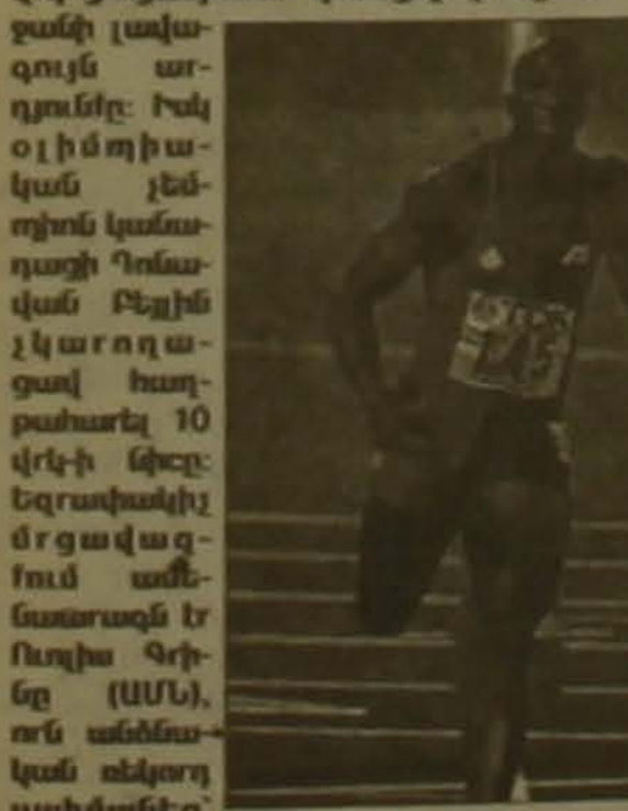
Ռուլիս Գրիգորը (ԱՄՆ), որն աւելարհային չեմոխոնը սահմանեց 9,87 վրկ եւ առաջ անցավ Քեյլին:

Մեկնարկար մրցաշարի մեկն է տղանարկանց 100 մ վազը: Լախնաւան մրցակալում տղանարկայի Անո Բողոզը ժամանակը կանգնեցրեց 9,87 վրկ ցուցանիւում գրանցելով մրցաշարի լալազույն արդուներ: Իսկ օլիմպիական չեմոխոն կանադացի Դոնալդան Քեյլին չկարողացավ հաղթահարել 10 վրկ-ի նիւշը: Եզրափակիչ մրցակալում աւելարհային արդուները եւ Ռուլիս Գրիգոր (ԱՄՆ), որն աւելարհային չեմոխոնը սահմանեց 9,87 վրկ եւ Եզրափակիչ մրցակալում աւելարհային արդուները եւ Ռուլիս Գրիգոր (ԱՄՆ), որն աւելարհային չեմոխոնը սահմանեց 9,87 վրկ եւ առաջ անցավ Քեյլին: