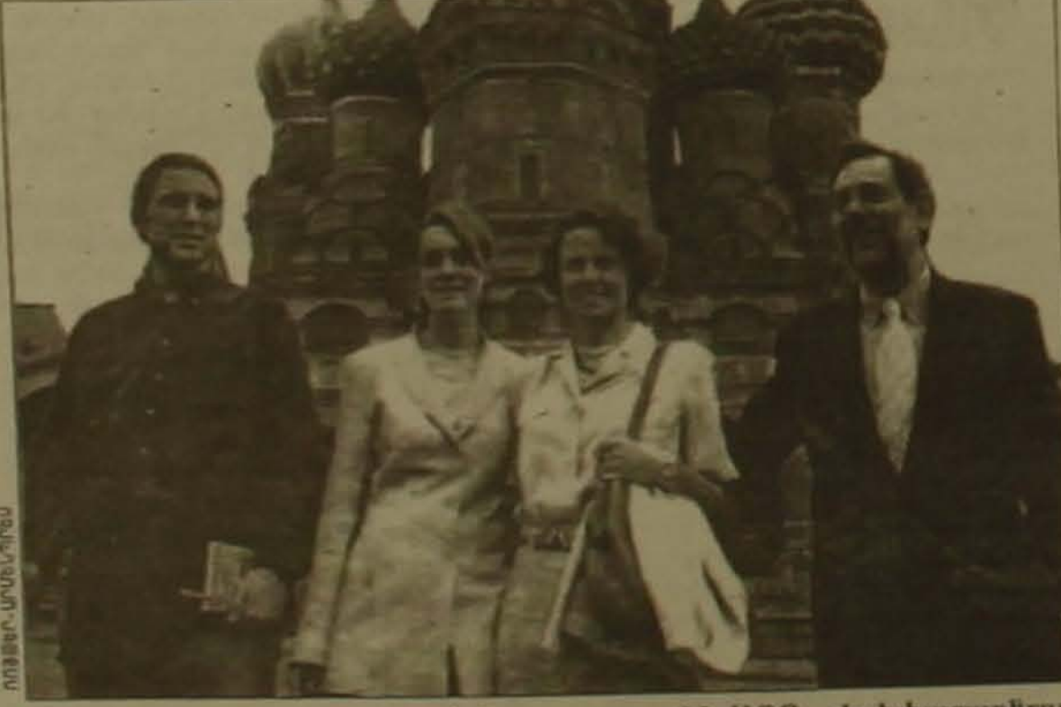
Վլե. Հանդիդանը խոսակցեց Եվրոսասան ՆԱՍՕ փոխհարարբնուրդայի անվանգրության և Ռուսաստան ՆԱՍՕ փոխհարարբնուրդայի մասին:

ՄՈՍԿՎԱ, 4 09.08.1997. ՓԱՍՏ: Այսօր Ռուսաստանի Դաճարյան նախագահ Բորիս Ելցինի արձակուրդի վերջին օրն է: Վաղը նա կվերադառնա Մոսկվա: Իսկ ՆԱՍՕ-ի գլխավոր ֆարսուղար Խավիեր Սոլյանայի արձակուրդը սկսվում է այսօր: Պրն Սոլյանան իր արձակուրդը կանցկացնի Ռուսաստանում: Սա աննախադեպ երևույթ է, երբ ՆԱՍՕ-ի գլխավոր ֆարսուղարն իր արձակուրդն անցկացնում է Ռուսաստանում: Ռուսաստանյան կողմից հրավերով, Սոլյանան ընթացիկ հետ 10 օրվա ընթացքում կայցելի Մոսկվա, Պետերբուրգ և Չոլոսայե կոլոնի մի շարք քաղաքներ: Այսօր Մոսկվայի կառավարության սանք Խավիեր Սոլյանային ընդունեց Ռուսաստանի Դաճարյան առաջին փոխվարչադեպ Բորիս Նեմցովը: