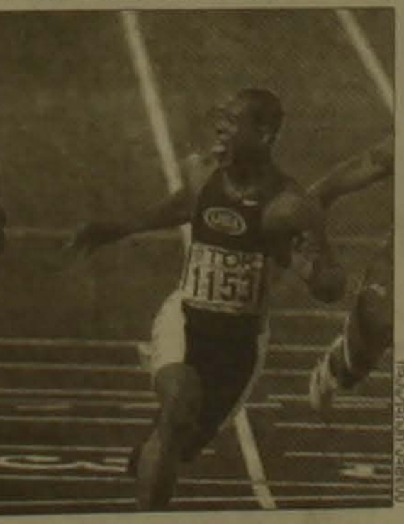
Ռուլիս Գրիգորը (ԱՄՆ), որն աւելարհային չեմոխոնը սահմանեց 9,87 վրկ եւ առաջ անցավ Քեյլին:

Մրձանեոդների դայաբարում աւելարհի չեմոխոնի կոչումը նվաճեց գերմանացի Գերման Դայնցը: Մրձաթե մեդալը բաժին հասավ ուկրաինացի Անդրեյ Ալովորուկին, իսկ բրոնզը ռուսաստանցի Վասիլի Միդորեկոյին: Կանանց