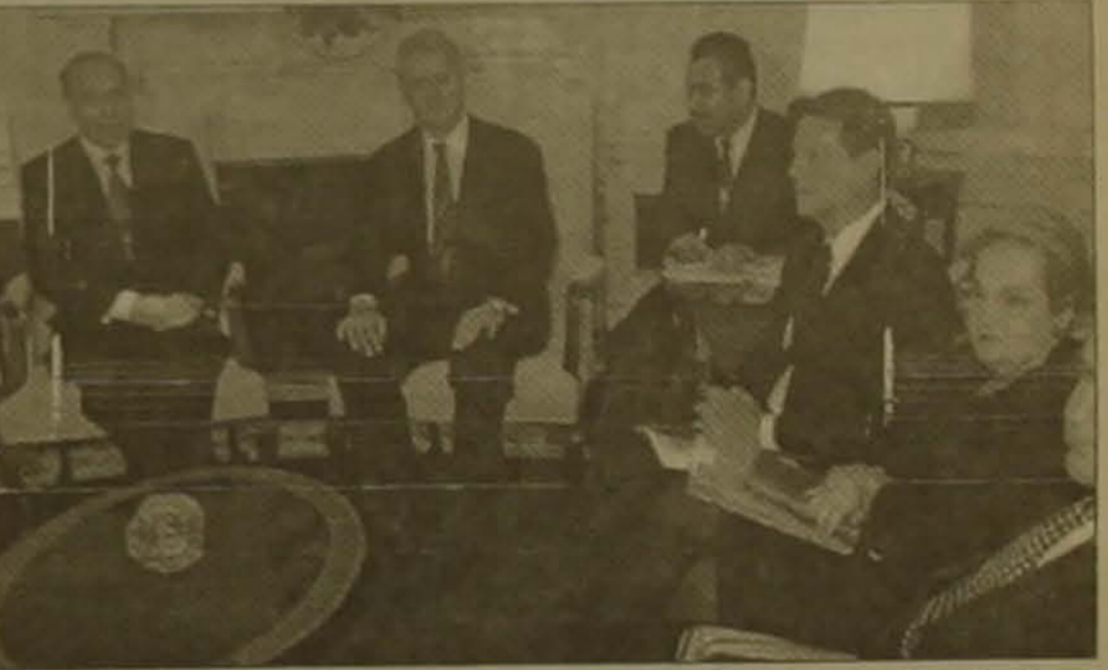
Նահանգների առեւտրի նախարարության ներկայացուցիչը հայտարարեց, թե իր նախարարությունն այս արվա վերջին գրասենյակ է

Ուրբաթ օրը Հեյդար Ալիեւի ամերիկյան այցելության ասեղային ժամն էր: Աղբյուրների նախագահն առաջին անգամ մտավ Մոլիսակ սան Բամոստով և ձվածնի գրասենյակում Երեւանի ժամանակով ժամը 19:40-ին հանդիպեց նախագահ Բլի Բլիսթոնին: Այնուհետեւ, ժամը 22:10-ին Ռուզվելթի սրահում երկու նախագահները կատարեցին ամերիկա-աղբյուրական համատեղ հայտարարություն, որից հետո ԱՄՆ-ի փոխնախագահ Ալ Գորդ Ալիեւի հետ ներկա կզգնվի Լեոնիդ Տիկալի բնագավառում ամերիկա-աղբյուրական համագործակցության դաժանագրի ստորագրմանը: Երեւի Հեյդար Ալիեւը հանդիպեց ԱՄՆ-ի դաժանության, Լեոնիդ Տիկալի և առեւտրի նախարարների հետ: Հանդիպումներից հետո Ս.