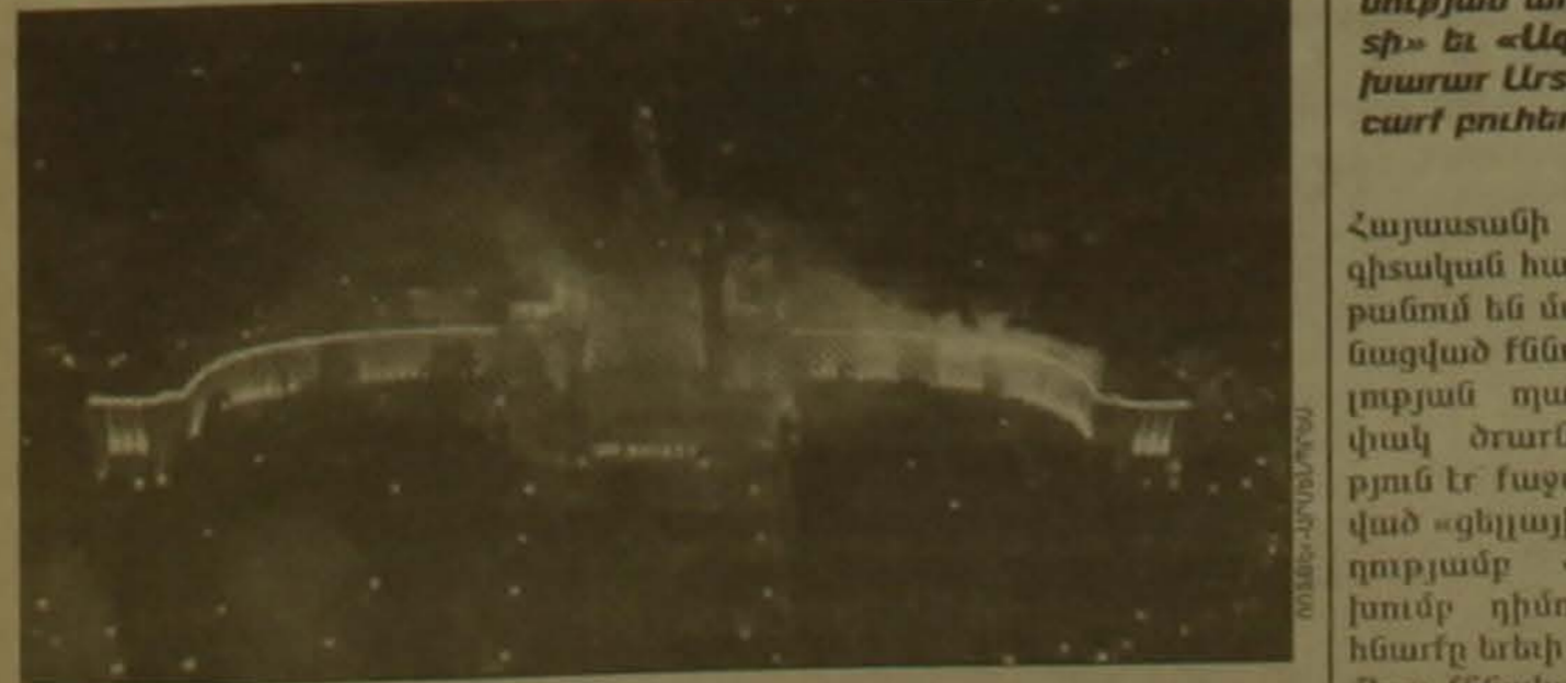
գեթի բարձրադիր ափին, էլ Ֆելյան աշարակի դիմաց: Հրդեհը մարակել էր դալասի ծախ թեղը, որտեղ գտն-

վում են Ֆրանսիական մոնումենտնե- րի թանգարանը եւ Կինոյի թանգա- րանը: Ինչո՞քն հաղորդել է թանգարանի սնօրեն Գի Կոմեյալը, այդ հրդեհը թանգարանների գոյության ողջ ըն-