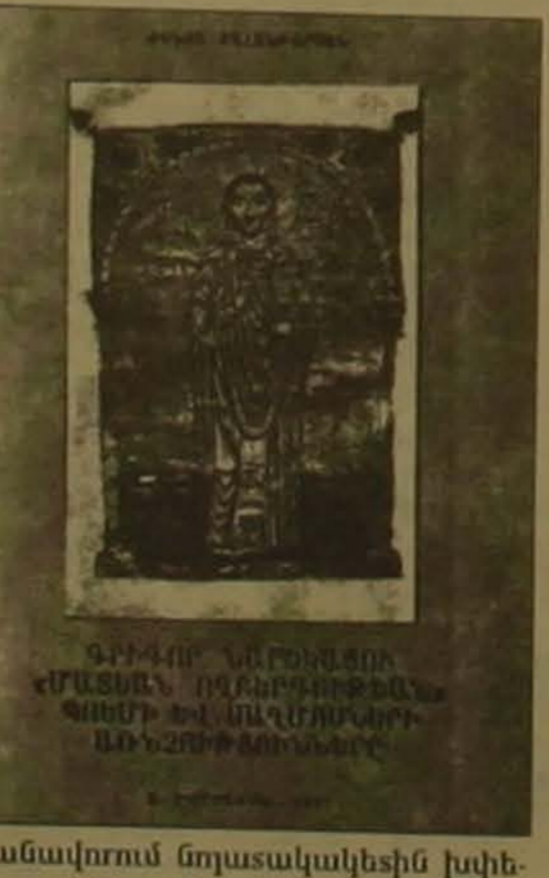
Մասնա ռեպրեզենտան «Գրիգոր Նարեկացու» Մասնա ռեպրեզենտան» դրանքի եւ սաղմունքի աննշանությունը» գիրքը: Գրականագետը հմտորեն համադրում է սաղմունքները մասնաճյուղի սաղմունքների հետ, հանգում գիտական եզրահանգումների, ընդգծում Նարեկացու երկի սեղծման մեջ սաղմունքի ունեցած դերն ու նշանակությունը:

Հարգարանի վրա է Ժենյա Զալանբարյանի «Գրիգոր Նարեկացու» Մասնա ռեպրեզենտան» դրանքի եւ սաղմունքի աննշանությունը» գիրքը: Նարեկացու մասնաճյուղի սաղմունքների հետ ունեցած աննշանություններն առաջին անգամն է որ այսպիսի ամբողջությամբ դառնում է հասուն ֆունկցիոնալ նյութ: Առաջադրված խնդրի լուծումը անցնում է բազմափուլ հարցադրումների միջով, ինչպիսի արժանազաններ են եղել նարեկացիագիտության մեջ այս հարցի շուրջ, ի՞նչ է սաղմունքը, ի՞նչ է աղբյուրը, ինչպիսիք են սրանց արտահայտման կերպերը, ինչպիսիք ժանրային եւ իմաստային առանձնահատկություններ են ընդհանրություններն ունեն սաղմունքը, աղբյուրը, դրանքը: Գլխավոր խնդրի բացահայտմանը ծառայող այս հարցադրումներն իրենց ամբողջական դասաստիաններն ստանում են ընդհանուր շարժումների մեջ: Առանձին եւ ամբողջական ֆունկցիոնալ նյութ են դառնում Մասնաճյուղի սաղմունքների՝ հետ ունեցած գաղափարական, կառուցվածքային, ոճա-դասկերպային աղբյուրները: Գրականագետը հմտորեն համադրում է սաղմունքները մասնաճյուղի սաղմունքների հետ, հանգում գիտական եզրահանգումների, ընդգծում Նարեկացու երկի սեղծման մեջ սաղմունքի ունեցած դերն ու նշանակությունը: