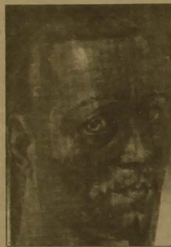
Ինքնանկար, 1936 թ.

Է. Քոչարի ծննդյան 98-ամյակի կապակցությամբ