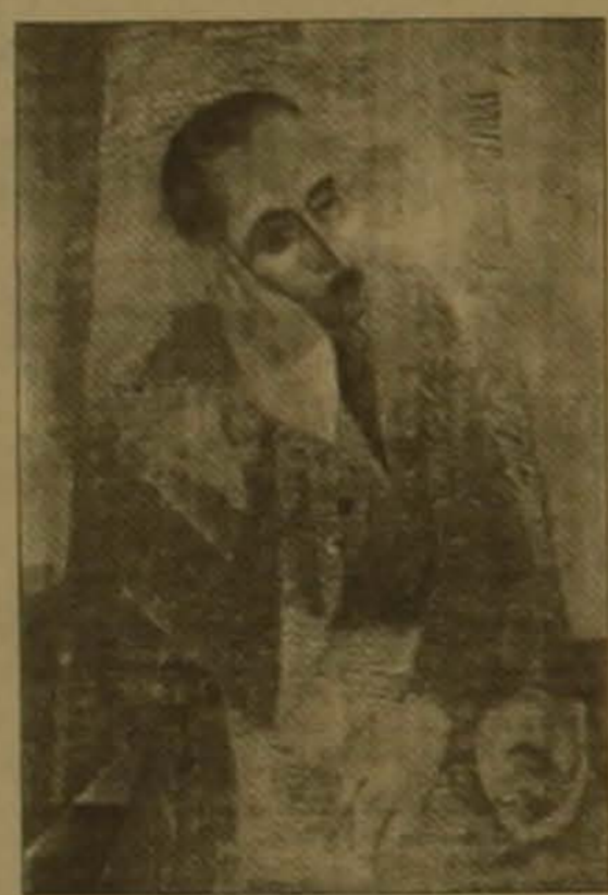
Բանաստեղծ Վահան Թեւեյան, 1924 թ.

Քոչարի ողջ սեղծագործության նկատմամբ խաղաղաշայից վերաբերումը ունենալով հանդերձ դեւս է նեւել, որ հեւփարիզյան երջանի նրա սեղծագործությունները