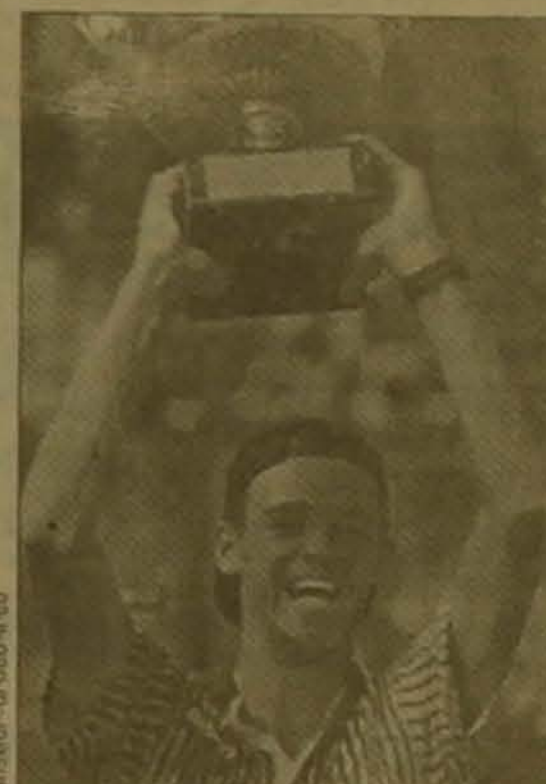
Պանացի Մերի Ֆուբային, իսկ Մայոլին ընդհանեց Եվեյցարուի Մարիանա Գինգիսի հաղթարձակը, որը կարճում էր 37 անընդմեջ հաղթանակ:

«Ռուս Գարոսի» կորեերում արժանացրեց թեմաի Զրանսիայի բաց առաջնությունը: Մենախաղերում ռուսաստանցի եվզենի Կաֆեյնիկովը լիարողացավ դաշտանել չեմպիոնի կոչումը, սակայն կրկնեց հաջողությունը զուգախաղերում: Ինչպես ես անցյալ արի, չեկ Գարոսի վաղեմը ես Կաֆեյնիկովը եզրափակիչ մրցամասում դարձրան մասնեցին աշխարհի ուժեղագույն զուգերից մեկին՝ ավստրալիացիներ Տոդ Վուդրիքին ես Մարկ Վուդֆորդին՝ 7-6, 4-6, 6-3: Կանանց զուգախաղերում միսկցի Լասայա Չվեբեան ես ամերիկոսի Ջիջի Ֆեռնանդեսը հաղթեցին Մերի Ջո Ֆեռնանդես ես Լայզա Ռեյմոնդ ամերիկյան երկյակին՝ 6-2, 6-3: Անակնկալներ գրանցվեցին մենախաղերում: Առաջին անգամ Զրանսիայի չեմպիոններ դարձան քաղաղացի Գուսապո Կուերեսը ես խորվաթուի Իվա Մայոլին: Բրազիլացիներ եզրափակիչում 6-3, 6-4, 6-2 հաճախով դարձրան մասնեց այս մրցաժամի կրկնակի չեմպիոն, իսկ