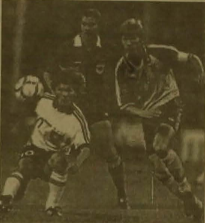
Ֆուտբոլիստները Ռիզայում 1-3 հաճախով զիջեցին ավստրիացիներին: Իսպանիայում քելատուները 0-1 հաճախով դարձրան կրեցին շոտլանդացիներից, որոնք 17 միավորով միանձնյա գլխավորում են մրցաժամային աղբյուրակը, թեև երկու խաղ ավելին են անցկացրել մոսակա հետադարձից Ավստրիայի հավաքականից:

Չորրորդ ենթախմբի րոյո թիմերն էլ անմասնակից չմնացին ընտրական մրցաժամի այս սուրի խաղերից: Տայվանում էստոնացիները համադրվածություն ցույց տվեցին շվեդներին, բայց դարձվեցին 2-3 հաճախով: Մեծ քաղաքյան մեկ այլ հանրադասության Լասվալայի հավաքականի