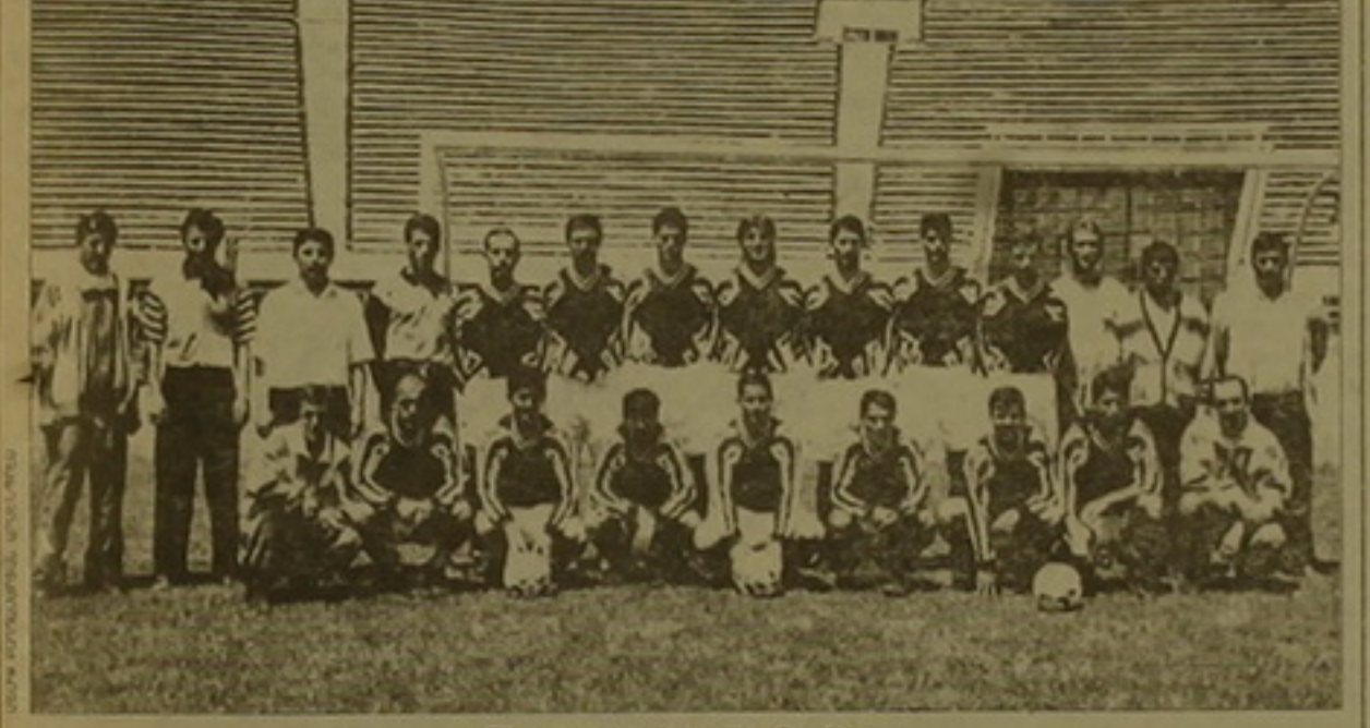
ՀՀ գավաթակիր Երևանի «Փյունիկը»

կազմակերպելու։ Ի վերջո, խաղն ավարտվեց 3-2 հաշվով «Փյունիկի» հաղթանակով։ Հանդիպումը գավաթի եզրավանդի շրջանում անկարգակ էր քննարկվում։ «Կոսայիկ» կարողացավ դասվել դուրս գալ