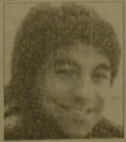
Քեյրոսի ՏՄԸՄ-ն և ՏՄՄ-ն հանդիպումները ռմբակոծության օսկ են ցուցաբերում։

Առաջին անգամ թենիս սառույցի վրա։ Քեյրոսի ՏՄԸՄ-ն և ՏՄՄ-ն հանդիպումները ռմբակոծության օսկ են ցուցաբերում։