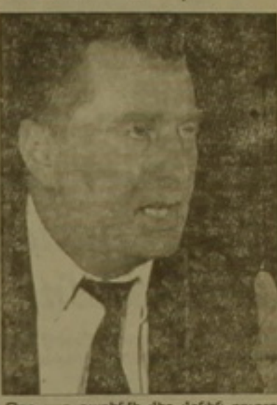
Թող այդ դաշինքի մեջ մենք բուրդ ումինները, սլովակները, լեհերը: Միգուց այդ ժամանակ կհասկանան, թե ինչ է նախադաս ժողովրդավարությունը»:

ՄԱՍԿՎԱ, 11 ԱՊՐԻԼ, ԱՐՄԵՆԻԱ: Բրախիսլավայի «Պրակա» տղազրել է Վ. ժիրինովսկու հարցազրույցը: Այն հարցին, թե ինչն ինչպես է վերաբերվում ՆԱՏՕ-ի ընդլայնմանը դեռի Արեւել, Ռուսաստանի լիբերալ-դեմոկրատական կուսակցությունը դեկալարել էր դաստրանել է. «Թող մենք ՆԱՏՕ-ի մեջ: Մեզ համար դա ձեռնու կլինի: Մեք և հայայեք այդ կազմակերպությունը: Երբ ՆԱՏՕ-ի անդամ կդառնա, կլեբարվեք դաշինքի բանակը, կմարել նրանց ճեփակիկները, իսկ նրանք ԲեՖ կանեն ձեր աղջիկների հետ: Զեր սարածաբանում կամի սոցիալական լարվածությունը: Մեզ ցաս է ձեռնու, որ ՆԱՏՕ մենք նախկին Վարսավայի դաշնամագրի երկրները, Մեծբալթիկան: