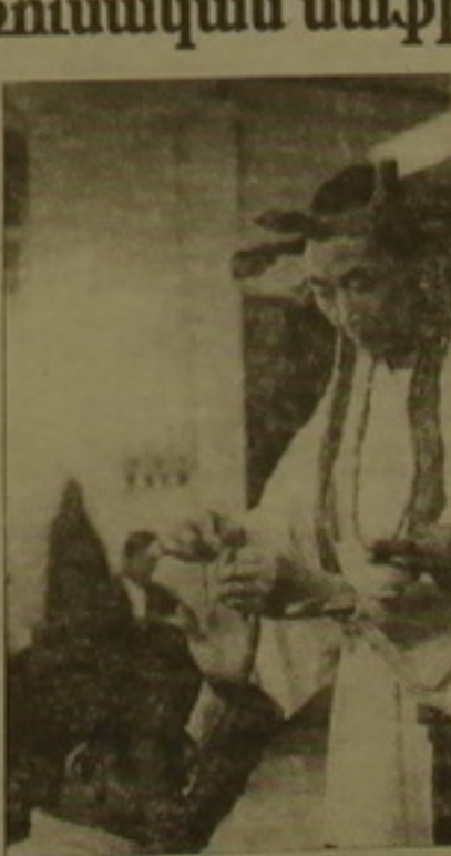
Կազմակերպական աջակցություն են գույց սալիս Հոնկոնգում հեռակերի սեղծման գործում: Հաշ

Չինաստանի հարավարևելյան գանգոլ բրիտանական այդ սիրույում ռուս մաֆիականները հայտնվեցին 1990 թ.: Հոնկոնգը նրանց նախորդում էր ոչ միայն չինական խոհանոցի բույրերով և մերսման սրահների կարմիր լաղիտներով, այլ և այն բանով, որ չինացի արկածախնդիր գործարարները նրանց ընձանում կին կեղտոս փողերի «լվացման» Լգակի և անսոման հնա