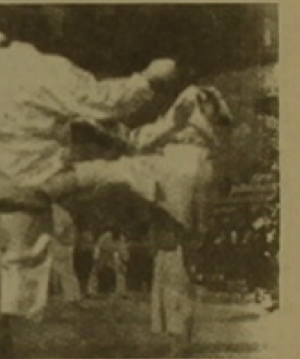
ասելով կարա (մեկ), դե (ձեռք) նշանակում է մեկ ձեռքով կրել: Այս բառին նա ավելացրեց նաև դո, որը ճապոներեն նշանակում է ճանապարհ: 20-րդ դարում վերջուրեկ կարասեն դասեռնադեպու նա նաչվեց միջազգային մարզածեր:

Բուդիստական անունով մի բուդիստական (ինդիական կրոնի կղերական), որը եկել էր Հնդկաստանից, 6-րդ դարում Չինաստան թեքեց կարասեն: Այս մարզածեր 10 դար ժողովրդական էր եղել: Միայն 16-րդ դարում կենդանվան քակ նորից երևան եկավ կարասեն իբրև Չինաստանի ծովագնացող գող նավաստիների դեմ դաստիարակման մի կոլաբս: Չինաստան-Վատոնիա հարաբերությունների ընդլայնմամբ այս մարզածերը հայտնվեց Օկինավայում: Վատոնիայում կարասեն փոխ-ինչ նորք սեփ սազավել էր գնդակահար սարածվեց ամբողջ երկրով մեկ: Առաջին անգամ այս մարզածերի մասին համարակվեց գրել Գիլիս Ֆունակուչի անունով մեկը: Նա է, որ սվեց կարասենի բացատրությունը: