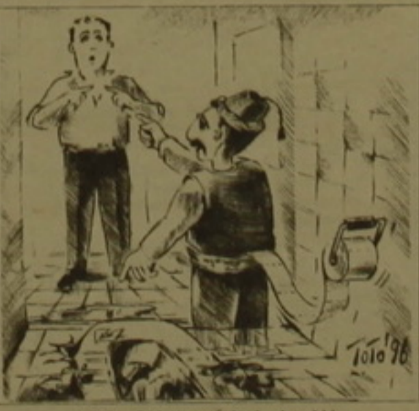
ամեն դեմով ուզում է վարկարկել մեծ հանրադեհությունը: Իսկ վարկարկելու լավագույն միջոցն այժմ

Անարկայության դեմ դայ ֆալի հարցը վերջերս աս մոդայիկ է դարձել: Եւրոպական զագարածողովներ են անցկացվում մեծ տարությունների դեկլարաների մասնակցությամբ, որտեղ իննարկվում է անարկայության խնդիրն ու այն, թե ինչ դասամիջոցների ոյեւ է դիմել անարկայությանը: Մյուս կարմից, աշխարհի ստասարար երկրների դեկլարաները կարծես թե միտել են իննարկել այն միտին, որ Դարաբաղին ոյեւ է իննիլիսան տեսության կարգավորման այլ մեակույթունեն քոզնելով այն Ադրբեջանի կազմում: Հայաստան էլ, թվում է, թե ինչ որ չափով ազատվել է երջանակումից: Այս ամենն ինարկել դուր չի գալիս Ադրբեջանի դեկլարատորյանը, որն