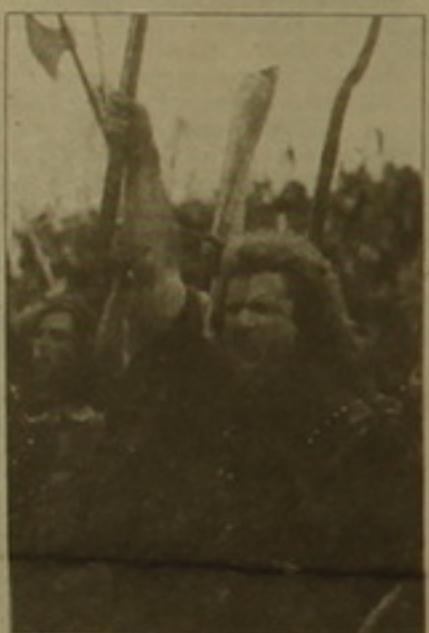
Կինոնկարի ակադեմիայի սարկան մրցանակաբաշխարարները, որը թրունան Կադրոսն նկարագրել է որդեա «միայն ֆալսաբանություն եւ հույզ, որ ոչ մի կաղ չունեն վասակի հեծ»:

Կինոնկարի ակադեմիայի սարկան մրցանակաբաշխարարները, որը թրունան Կադրոսն նկարագրել է որդեա «միայն ֆալսաբանություն եւ հույզ, որ ոչ մի կաղ չունեն վասակի հեծ», հիմնադրվել է 1929-ին, Լուիս Մեյերի կողմից արժանին հասցնելու սարկա լավագույն ամերիկյան կինոնկարին: