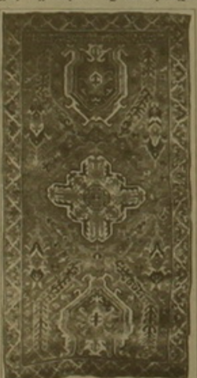
Վիճակագրող Գեորգ 1696 թ.

նախագրան կիրառվելի ազգագրական հանդեսի 100-ամյակի առիթով: Այնուհետև «Դասնականի Կանոնադրությունները» վերնագրով ցուցահանդեսը կներկայացնի 3 հանդիմանությունների համառոտ դասնությունը նոր փաստաթղթերով: Սեղծված թանգարանի «Արմավիր մ.թ. IV-1 դդ.» ցուցահանդեսից հետո հոկտեմբեր-նոյեմբերին կբացվի «Տիգրան Մեծ» ցուցահանդեսը նվիրված գահակալության 2090-ի մահվան 2050-ամյակին: Իսկ առաջինը կառուցվում ապրիլի առաջին կեսին կբացվի Վիճակագրողի ցուցահանդեսը «Ազգ» օրաթերթի հետ համատեղ: Զուգահանդեսի հրավիրանումը հայագրերը, բուկեցը կհրատարակի օրաթերթը: Զուգահանդեսը են թանգարանի շենքին Ալեքսեյ Զահնազարյանն ու գործադրեց Լուսինյանը, որը նաև բուկեցի հեղինակն է: