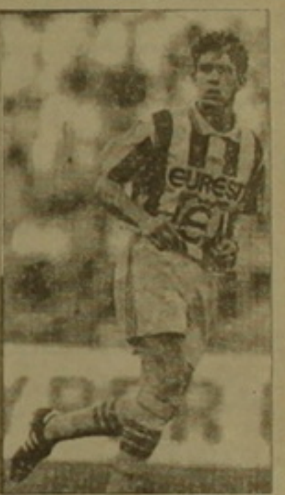
«Դանես» զխաղոր ուղարկու Ուեդելը

դաս Մարթին Եվոմիտային: Այդ ժամանակ հաշիվը դեռ չէր բացվել: Սակայն այդ դասը ճակատագրական եղավ լեիր ֆուտբոլիստների համար: Ընդ որում, իր հայրենակիցներին դասժեց «Պանաթինայիկոսում» խաղացող լեիր լեգները Զեմոլիտայի կողմից, որը 2 անգամ գրավեց «Լեգիայի» դարպասը: Այլի ընկավ «Պանաթինայիկոսի» եւ մեկ լեգներ արգենտինացի Խոսե Խոսե Վարեյան: «Պանաթինայիկոսը» հաղթեց 3-0 հաշվով: «Այաքս»-«Քորոսիան» մրցավնեում երկուստեղների խաղորն ապելյ դարձին էր: Զեմոլիտների լեգայի նախորդ խաղարկությունը հաղթող «Այաքսը» Գործադրում տեղի ունեցած ամառյին խաղում առավելություն էր հասել 2-0 հաշվով: Չնայած սեփական հարկի սակ մրցակցին «Այաքսը» խաղաց զխաղոր բարձրագույն կազմով, քանի որ ամառյան խաղացողներից ու մանկ վնասվածներ ունեին, իսկ ուման էլ որակագրկամ էին, սակայն հաղթեց 1-0 հաշվով: 85-րդ րոպեին վնասված գոլի հեղինակ դարձավ սեւաճոր Կեքի Մոսադոն: Կիսաեզրակի կիսաեզրակում զխաղոր Իրանիսները համարվում են «Այաքս»-ը ու «Յուվենտուսը»: Հնարավոր է կրկին եզրակի կիսում հանդիպեն Հոլանդիայի եւ Իսպանիայի ներկայացուցիչները: