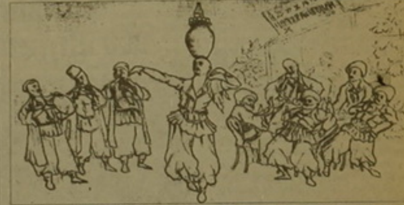
Հայկական մակարոնով: Ֆայերին ու անգլերեն տղազված զեկուցումները...