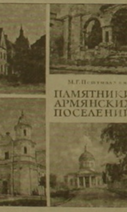
Հայոց գաղթընթացի բազմաթիվ են, սղաւման կարգին մոտեցնել դրանց դասաւարան հուշարձանները:

«Շատ են սիրել բնությունը, երկրաների և ուսանող աղջիկների նկարել», դասում է դարձնում Փեւստայրանն ավելացնելով, թե Մոսկվայում կայացած երեսուցամյա լուսանկարչության և ուսանողության միջազգային վաստակունքի երկխոսությունը լուսանկարներից մեկը 1957-ին Ռուսիա մեղա է բերել: Երկուսը սիրելի գրագրուները ճանաչողներին է կոչել: Ինչը բնավ էլ դասաւարան չէ լուսանկարչի համար: Առաջին անգամ 1958-ին Երզրակյան է Թեոդոսիայով մեկ լուսանկարել ճառած արժեքավորը: Այնուհետև՝ Երև, Արեւստան Ռուսիան, Էփո: Գրագրու էին բոլոր այն հայերն էլ, որոնք կային նրա հասցիները, որտեղ ճանաչողությունը լուսանկարչի այլը հայրական քննող մի գաղափարով էր հայտնաբերում: Նորից դիմեմ դասաւարան գիտականին: «Նա մեկ մեկնակ մի արեւիկների գործ է կատարել և բնորոշողին հնարավորություն է բնութաւորում»: