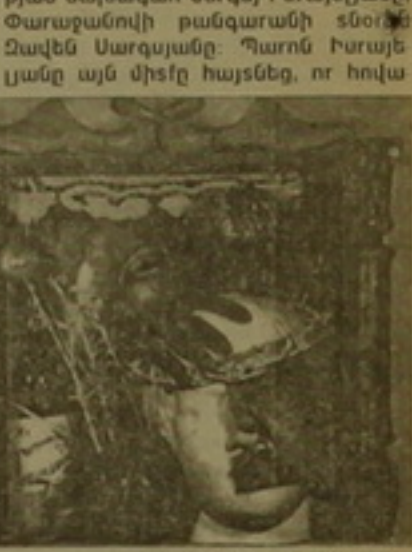
Փարազանուլի կուտներինց նախորդ գեճելու դեղում, կկազմակերպվի վրացական կինոյի փառատոն: Ցուցադրվեցին հասկաններ Փարազանուլի «Աւուղ Դարիք»-ից: Կինոնկարը ամբողջությամբ կցուցադրվի ռաղիկայում Կինոյի տանը: 3. 11.