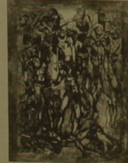
Վալմար. «Պայմար» շարքից, 1989 թ.

Հունվարի 31-ին հայաստանից 4 նկարիչներ Ալեքսանդր Գրիգորյան, Ռոբերտ Էլիթիկյան, Հովհաննես Հարությունյան և Վալմար հանդես են