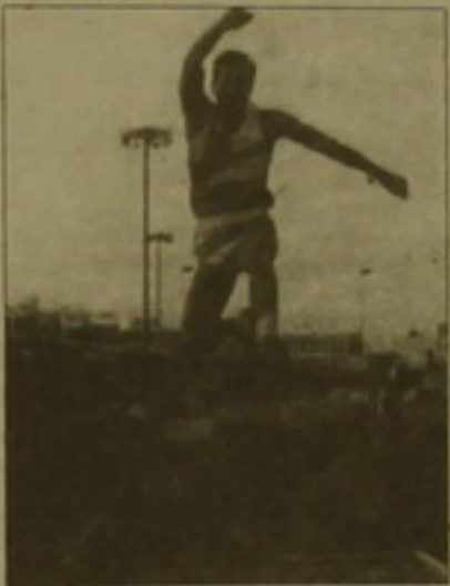
Յաւազում է Ռոբերտ Էմմիյանը վազույն արդյունքը (871 սմ): Պեդրոսն «Քերսիում» էլ բարձրության

Փարիզի «Քերսի» հանրամատչելի ծածկած մարզադահլիճում տեղի ունեցավ բերեւ ազնեիկայի Իրանսիայի բաց առաջնությունը, որը վերածվեց միջազգային խոճորագույն մրցաւարի: Պատանակաւ մեկնարկներէից եւ օլիմպիական խաղերից առաջ բացեալի համար դա ուժերի կարեւոր ստուգասն է: Ապարեզ էին դարս եկել սպորտի բազում աւախահաւոյակ բաց ներկայացուցիչներ: Մեզ հասկալոյս հետաքրքրում էր տղամարդկանց հետազատակի մրցաւարը, որին մասնակցում էր Եվրոպայի ռեկորդակիր Ռոբերտ Էմմիյանը: Մեր հայրենակիցն ամենայն յոյսով արժանացաւ խաղերին: Ընդհանրապէս հետազատակներէի մրցաւարն առանձնահատկ հետաքրքրույն էր առաջացրել, քանի որ մրցաւարն էին բնական բաց հետազատակները: