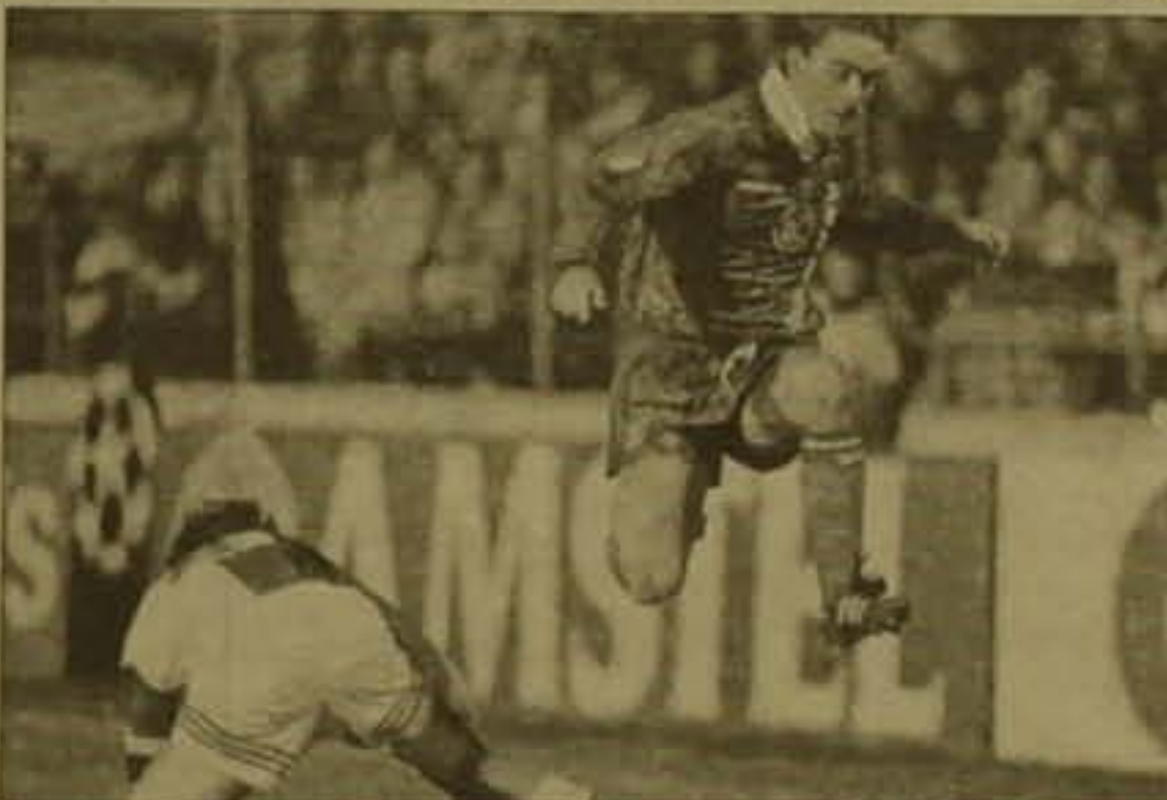
Մարտիկաները հաջողության հասան հանդիպման նախ 20 րդ. իսկ այնուհետև կ 32 րդ. րոպին: Շուտակիցները հաջողության հասան երկուրդ քայլ բողբոջելով 3 ռոպանոց: «Օսեր»-ը, հարթելով 2-1 հաշվով «Այախ»-ի հետ դուրս եկավ հաջող վայր:

«Ց» ենթախումբում Մայրեյել «Ալբիստին»-ը եւ Գոթորոնդի «Բորուսիան»-ը հեծես նախորդ արժանակը կին որսադար շարունակելու ի