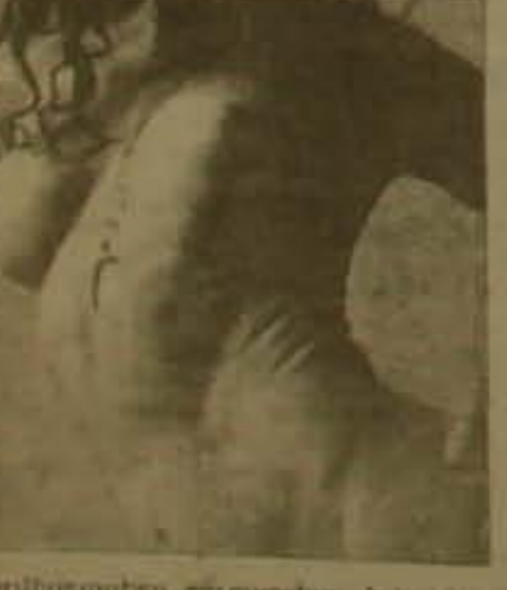
Արվեստագետը զուգարչելու է իր ժամանակակից ստեղծագործությունները կատարված մեծադար թրթրի վրա: Լեոնը, ներկայացրած է երբ եւ որքան, դասավանդելու է ժամանակակից քանդակագործական ձևի մեջ: Ցուցանանդեսը տեղի է մեկ ամիս: