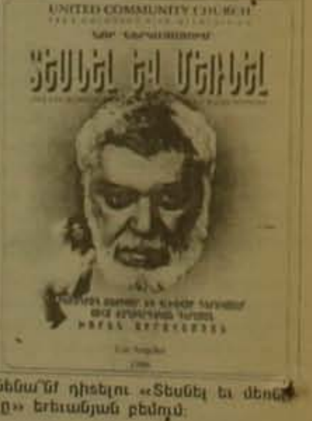
Նենա՛ն դիտելու «Տեսնել եւ մտնել» Երևանյան բեմոյժ: