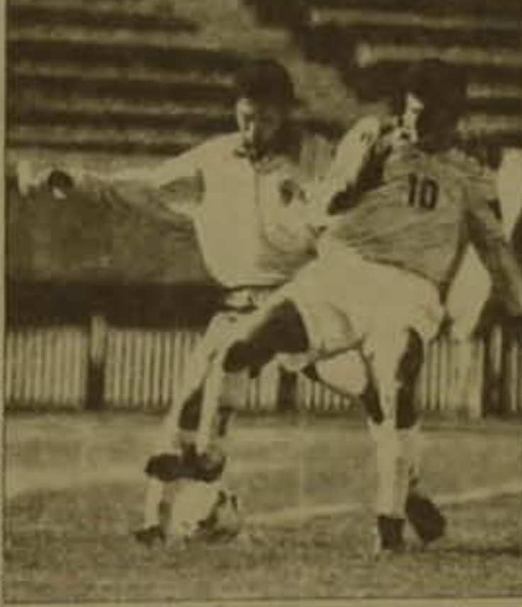
Gjnidrhb - Chrmbb - gibunger adgurbat Urm

ջին խաղը օգուտաի 8-ին, կայանայա է Արովյանում։