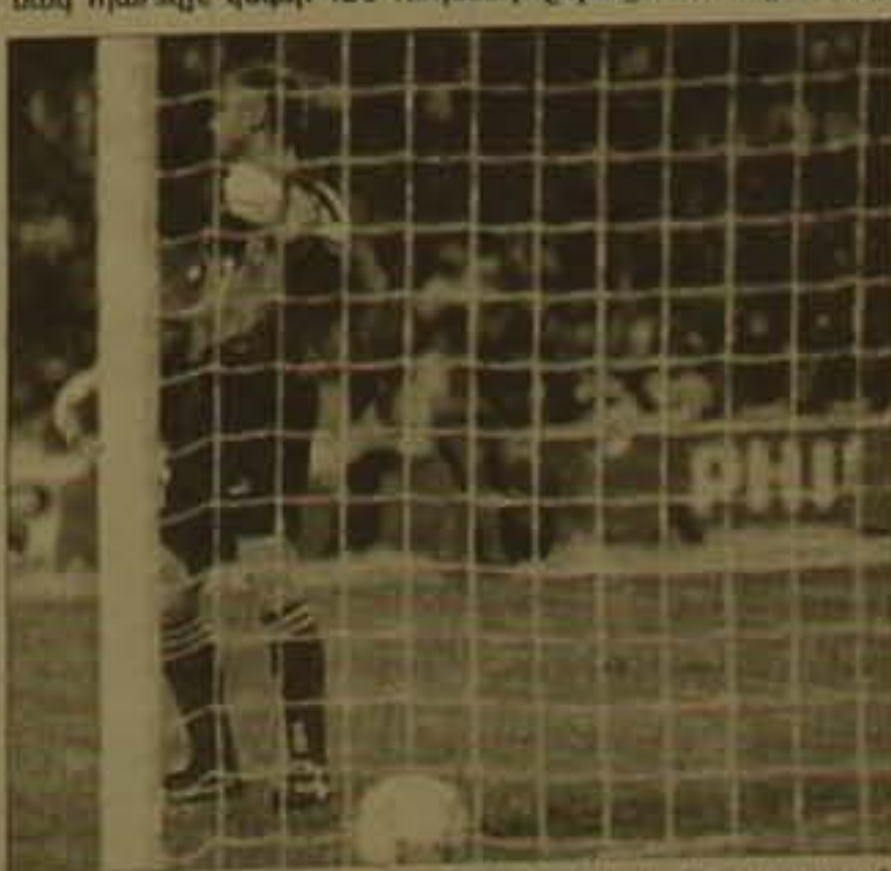
-flott geguig- Ithhujh hudulutubuth gurmuunid

կում էին 11 մեջուսնոց հարվածներն իրացնել հանդիդումնեrhg wnwg. Այն թիմը, nrp 11 մեsrանոց հարվածների ժամանակ դառովի կօգոի 120 ուղեների ընթացքում հաղթանակի