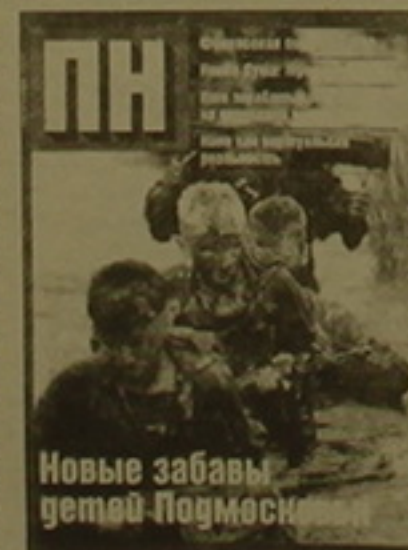
Նեն Ռուսաստանի հեռ հասուկ հարսերություններ:

Մոսկվայի խայտարեց մամուլը հարսացավ ես մի նոր բարբարերով: Լույս տեսավ «ՈՒ» նկարագրող ամսագիրը, որի գլխավոր խմբագիրն է «Նեզավիսիմայա գազետա» հայտնի օրաթերթի խմբագիր Տեղակալ Ալեքսանդր Գազուան: «Նեզավիսիմայա գազետա» հեռ կառված հայտնի դեպրեթից հետ խմբագրության աշխատակիցների մի մասը Ալեքսանդր Գազուայի գլխավորությամբ հեռացան և հիմնեցին այս նոր դարբերականը: Այն այլի է ընկնում բարձրակարգ տպագրությամբ, բազմալան, ճեղքատված, մշակութային և այլ բեմաների բազմազանությամբ: Բաղադական բաժնում մեծ տեղ է տրված Պեդրոսյանի ընտրությունների արդյունքների վերլուծությանը, ԱՊՀ զարգացմանը, հեռանկարներին: Հողվածագիրը մասնավորադես նուս է, թե Հայաստանը ԱՊՀ ին մասնակցությանը վերաբերվում է որդես կողմակալ անխոստակելիություն, որովհետև ասանց դա դժվար թե հնարավոր լի