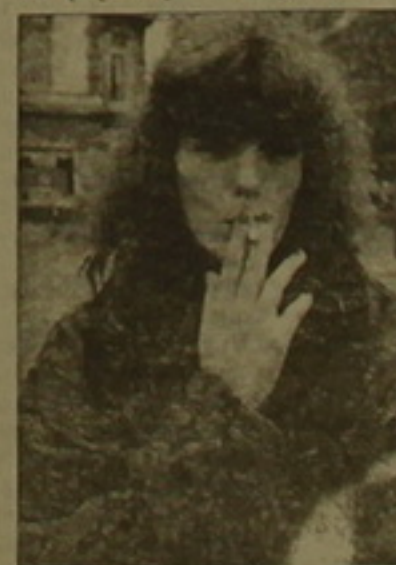
Ժխելու արտաքին: Արգելված ողջող Երևանը: Տարիներ առաջ, կր նախարարական սիտային սեստարաններն առաջին անգամ հայնվեցին Արևանին, հանդիաստեանի բառացարեն այրվում էին հուզմունքի ու իրավունքից: Այժմ համարյա թե

Առաջներում էլ ծխեր սյուն և կրի հետ Իր Երևանը: Հիշենք թեկուզ հանրահայտ Կարմենին: Այդ կրտս խոլանանին, ոչ դրաստանական մանրամասն, ծխախոտի խոլանանում էր աղխաստ: Հողիվողի երեանի առողջը, Մաղեն Դիտիլան, օրինակ, առանց ծխացող սիգարետի Արևանին չէր հայնվում: Այսօր, սակայն, ծխելու դեմ Արևանում համընդհանուր և անողով ողջաբար է սկսվել, որն Ամերիկայի ծեռնինին 20 արևան րվակների «չոր» օրենքն է հիշեցնում: Երեանի միանգամայն սոլորական գրադմունքը վստիգավոր աղխաստանություն է վերադարձվել, որ մարդկանց ու հաստարկության հանդեպ որդես մարտարավի է ընկալվում և նույնիսկ հուզմունքի ալիք է բարձրացնում: Միևուր հանդեպ վերաբերումն Արևանում այնքան կտուկ է փոխվել, որ ծխողներն իրենց հալածված ու հետադարձվող վաճառատնություն են համարում, ում իրավունքներն անխնայ անհանգրվում են նոր սեսակի բոնգալություն, ցատալովների կողմից: Հանրային կազմիի Երևանում այնքան կտուկ է, որ աղյուս է րեղ յուրոիանի և համարյա ընդհասակյա մի գրակնություն, ամսագրեր, րոնյուներ, բոնգիկներ, որոնցում մանրամասն նկարագրված են ինչ և նոր ֆիլմերի այն սեստարանները, որտեղ հերոսները տրվում են վերջերս դեռ անմեղ համարվող