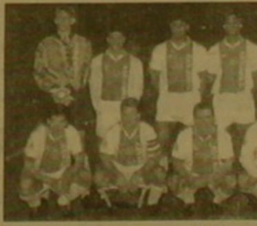
Ղոսանղայի լեճղոս «Աղաղ»

«Աղաղ» քիմը գերաղանց հանղեղ եղակով նաեւ իր երկրի առաղոսթյունում եւ մրցաճարի աղարսից երկու սուր առաղ նղաճեղ Հղաղոլիայի չեմղոլոսի կոչումը։ «Աղաղ» առաղոսթյան անղեղաղում 32 հանղիղոլմանում ոչ մի դաղոսթյուն չի կրել։