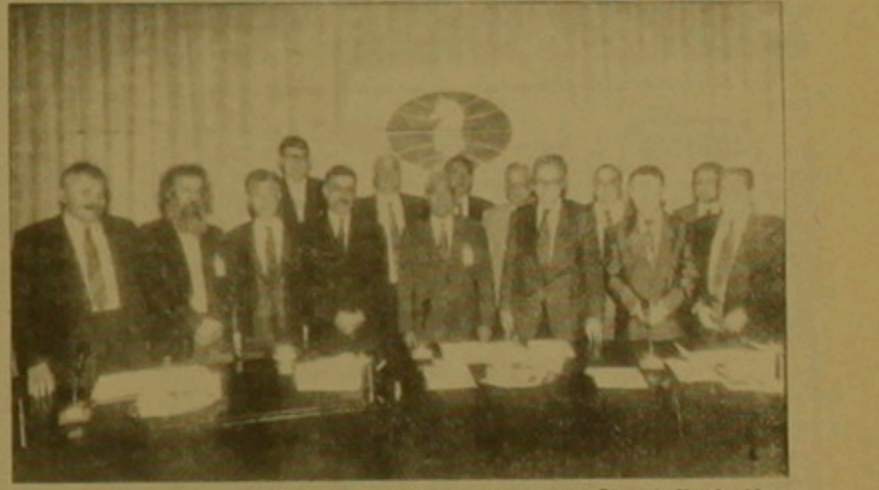
ՖԻՖԱ-ի ղեկավարների խորհուրդը Ռիզայի նիստից հետո

ՊՇԱ-ի Եվրոպական 5-րդ գասու ղեկավարներն Միխայիլ Տալի հուշամրցաշարին զուգահեռ Ռիզայում ընթանում էր ՖԻՖԱ-ի ղեկավարների խորհրդի եւ գործադիր կոմիտեի նիստը: Այն կնարկեց էախմասային կյանքի կարեւորագույն խնդիրներ, որոնցից էաշտը անմիջականորեն անցվում են Հայաստանի հետ: Տողերիս հեղինակը եւ ՖԻՖԱ-ի ղեկավարներն իրարմարտի կամուրջանաղ, որը վերջին ամիսներին երկու անգամ վերահսկիչ այցելություններով եղել է Հայաստանում, ներկայությունն ծանոթացրին երեսանյան օլիմպիադայի նախագիծնեական խորհուրդը միաձայն որոշեց աշխարհի առաջնության միջփնջայինն անցկացնել Հայաստանի մայրաքաղաք Երեսանում եւ օլիմպիադա 96-ի կազմկոմիտեին հանձնարարեց անմիջապես կազմակերպել այս մրցաշարը օլիմպիադայի նախադասանական փառասնոցի ցրանակներում: Միջփնջայինի կոնկրետ ժամկետները հայտնի կդառնան առաջիկա օրերին ՖԻՖԱ-ի, ՊՇԱ-ի եւ երեսանյան կազմկոմիտեի լրագուցիչ խորհրդակցությունից հետո: Եվ այստեւ, Հայաստանի մայրաքաղաքը կդառնա աշխարհի չեմպիոնի կոյման համար դայալարող 72 ուժեղագույն էախմասիստների մրցաշարը: