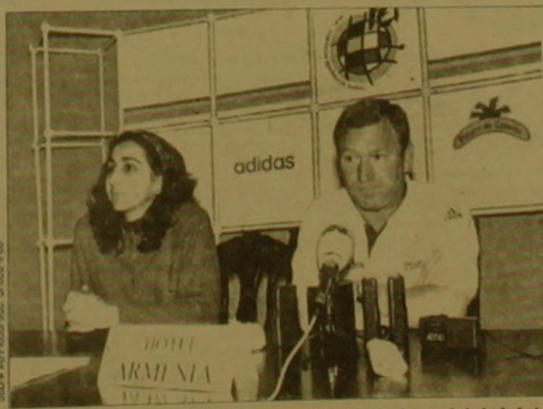
Իտալիայի հավաքականի մարզիչ Կլեմենտեի մամուլի ասուլիսի ժամանակ

Բնականաբար, առաջին հարցը, ուղղված կյուրերի մարզչին, այն մասին էր, քի ի՞նչ գիտի ինքը հայկական ֆուտբոլի եւ Հայաստանի հավաքականի մասին: - Մենք դիտել ենք Բելգիա-Հայաստան եւ Հայաստան-Կիորոս հանդիպումներին տեսագրությունները, օգնական կարող եմ ասել, որ ոչ ինչ չգիտեմ Հայաստանի հավաքականի ու հայկական ֆուտբոլի դասախոսության մասին: Անկասկած իտալական ֆուտբոլի ավելի ուժեղ է, քան հայկականը: Ես, իհարկե, հասկանում եմ, որ մեր միջոցներն անհամեմատ լավ են, քան մեր: Այնուամենայնիվ մենք ոչեք է գոյություն ունենում ուսուցողություն դարձնենք դաշտանությունը: Փոփոխ քիմերն ընդունակ են անակնկալների եւ նրանց ոչեք է հարգել: Մեծ քիմերն հետ փուլումները նրանց անհրաժեշտ են եւ արագորեն կարող են առաջընթաց աղբյուր: Եւ մարտիս ասած, ես սկզբից դեմ եմ եղել, որ բույլ քիմերը միանգամից իրավունք ստանան մասնակցել Եվրոպայի առաջնության ընտրական մրցաշարերին: Ես կողմնակից էի, որովհետեւ ստեղծվել նախնական ընտրական խումբ: - Թիմն ի՞նչ մարտական կազմով է ժամանել երեսան: - Անավարձների դասախոսով երկու փոփոխություն կա, քիմ ո