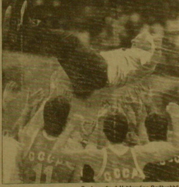
Օգ է սլանում Ալեքսանդր Գոմելսկին

Բասկետբոլի միջազգային ֆեդերացիայի «ՖԻԲԱ-բասկետ» ամենօրյա դաստիարակ հանդեսը ծավալուն հոդված է նվիրել ռուսական բասկետբոլի վերածնունդին: «Աշխարհափոշի մարզիչ, Սեուլի օլիմպիական խաղերի ոսկե մեդալակիր, Խորհրդային Միության բասկետբոլի հավաքականի գլխավոր մարզիչ Ալեքսանդր Գոմելսկին այսօր փորձում է վերականգնել Եվրոպայի նախկին գավաթակիր Մոսկվայի բանակայինների երբեմնի փառքը, գրում է հանդեսը: 1971-ին Անսֆորմեմոն (Բելգիա) ԲԿՄԱ-ն, 67-53 հաճվով հաղթելով Իսպանիայի «Աելեզ» բլանկին, փնտրել էր երոտական երկրների չեմպիոնների գավաթին: Մակայն դրանից հետո, հակառակ 1972-ի եւ 1988-ի մյուսխնայան ու սեուլյան օլիմպիական ոսկե մրցանակներին, ռուսական բասկետբոլի հեղինակներն չհաջողվեց ճանաչվել եվրոպական ակումբների չեմպիոնների սիստեմը: