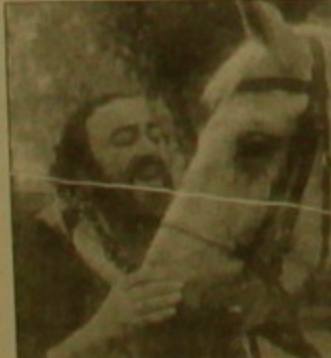
«Յուրկոսմեթի» ընկերության միջոցով արտադրություն կիցեցնի օծանաչուր (լույսն)՝ շղամարդկանց համար: Իսկ արճեւալուրը՝ ինչոյեւ մի հարուստ անճնախորության առեւանգումը: Իր օգնական մի խումբը քրալակիցների հետ համատեղ վիթխարի հետազոտական հանճնախորություններն ու օծանելիքները: Ինչոյեւ տեղեկացնում է զովագղը, Պավարոսին նախադասություն է սալիս «Երեղի զեղախարդաներին»:

Շուտով Լուիսանո Պավարոսիի երկրադուրերը ուրախանալու նոր առիթ կունենան օտերային ասղի «քույրը» ձեռք բերելով: Բանն այն է, որ ասղի լից նեանավոր տեղորը իտալական