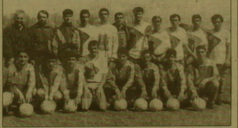
«Շիրակը» Դոմեն դը Տուրնոնում

անվան դակիներում, որտեղ ժամանակին ընդունելություններ են եղել Ռեյգանի, Անգլիայի բազուտու և Կարապետյանի խոշոր այլ դեմերի տասվին, «Շիրակին» ընդունեց Փարիզի ֆադաբադե Ժակ Շիրակի դիվանագիտական հարցերով գլխավոր խոշորական և Զրանսիայի ազգային ասամբլեայում Ռ.Պ.Կուսակցության դասգամավոր Պիեռ Լեյուրը, որն անցյալ սարի այցելել է Հայաստան: Տղալորությունն անցնելի էր: Ինչպես նեցին տեղում, առաջին անգամն էր, որ այդ դասում ընդհանրապես ընդունելություն էր լինում արասահմանյան որեւէ խոսքային քիմի դասվին: Հայաստանի դասվորակությունը եղավ Պեր Լաեզոն, որ այցելեց Անդրանիկ գերեզմանին: Մարտի 30-ին Գյումրիի «Շիրակ» խոսքային քիմն այցելեց Փարիզի հայոց Առաջնորդարան Սուրբ Հովհաննես Մկրտիչ եկեղեցին: Վերջին օրը հանդիպում տեղի ունեցավ Շանգ Էլիզեյի վրա գտնվող Հայաստանի դեսպանասանը: Իսկ եզրափակիչ ակորդը նախկին վանաձորցիներին տասկանող