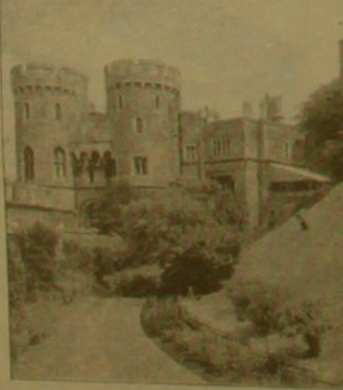
Թեմզա «գեթ» վրա, Լոնդոնից 37 կմ դեղի արեւմուտք Բեկեյր կոմսությունում գտնվող անգլիական քաղաքից Երեսանի գլխավոր ամառանոց նստավայրը հիմնադրվել է Վիլիելմոմա Օռլի կողմից, 11րդ դարում:

Անհրաժեշտ գումարն աղաղակելու համար քաղաքին նախանցյալ սարվանից դիմել է աննախադեղ մի Բայրի գրասարքիչների ասաջ քաջ անելով Բեկինգեմյան դրյակի դոնեղը: Նախ 12, իսկ այս սարվանից 13 դոլլար վճարելով վերջիններս հնարավորություն է սրվում Երեսան դրյակի 18 դահլիճները, որոնք մեկը մյուսից Երեսան ու գեղեցիկ Այդ գումարներով կարելի է եղել առայժմ ավելի քան 6 միլիոն ֆուլես ստեղծելով (9 միլիոն դոլլար) հավանել: Գիտողները կհասցան են, որ մինչեւ վերանորոգման ավարտը գրասարքիչներից գանձված գումարները մեծավ մասամբ կծածկեն անհրաժեշտ դրյակը 1998 ին դարձյալ կընդունի իր ավանդական վառավոր տեսքը: