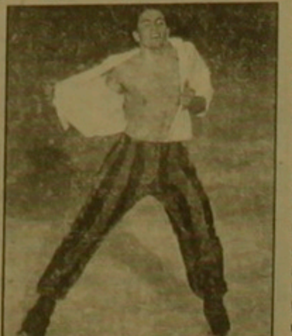
Շեխուվա Վադիմ Նաումով Ռուսաստանի գուգու:

Անգլիայի Բիրմինգհեմ քաղաքում ավարտվեց գեղաստի աշխարհի հերթական առաջնությունը: Ինչպես նաև Ռուսաստանի հեռուստատեսության մարզական մեկնարկան Գեորգի Մարգարյանը, առաջնությունն այնի ընկավ երեք կարգով գործունեություն: Առաջինը այն, որ չորս ծեծերից երկուսում չեմպիոնները փոխվեցին, երկրորդը, որ առաջին անգամ աշխարհի չեմպիոն դարձավ Չինաստանի ներկայացուցիչը կանանց մեծահասակներում հաղթեց Լյու Չենը և երրորդը մրցակցների կանխակալ կողմից սխալներն էին: Ըստ մեկնարկանի Ռուսկա Կավալեյ Իրենա Նովոսնա չեխական երկրացի գուգաստներում առաջին տեղ չեղավ: Մրցակցներն այդ նվաճվածությունն արեցին, ֆանի որ վերջիններս հրաժեշտ են արել գեղաստիին: Ըստ Մարգարյանի՝ գուգաստներում չեմպիոն ղեկ է դառնալ եղանակ