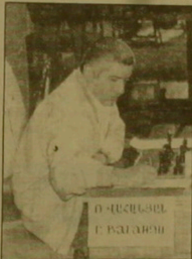
Վահանյանը Ռեջիոյի կազմում:

կորյանը երկարատև դասերից հետո սեներով ոչ ոքի խաղաց Տիվա կուլի հետ եւ այժմ ունի 1.5 միավոր: Աղյուսակը 5-ական միավորով գլխավորում են Կարոյով, Իվանչուկը եւ Թոմիայովը: Հերական սուրում նրանք բոլորը հարթեցին Կարոյովը Խաղիմանին, Իվանչուկը