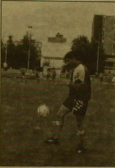
Վայրը: Երբ Էրիկ Էոլին հասկացվի, առաջընթաց է աղբյուր եւ հայտնի է դառնալու եւրոպային ոչ միայն «Աւրաշի» շնորհիվ: Բայց դրա համար անհրաժեշտ է սանել ֆրանսիացիներին:

նդասակարգված աշխատանք: Նախ ֆուտբոլի ֆեդերացիան ղեկավարում էր Էրիկ Էոլին, որի անունը իր անունին աշխատանքը: