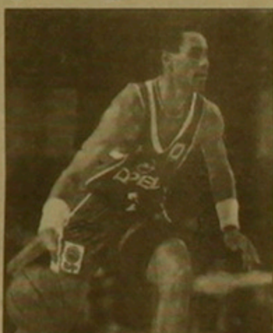
8 ուժեղագույն քիմերի եզրափակիչ մրցախաղում:

Բասկետբոլի զգամարկանց եւրոպական ակումբային քիմերի առաջնության խմբային մրցախաղի վերջին տուրում Մոսկվայի ԲԿՄԱ-ն ընդունեց Իսրայելի «Մակկաբի» քիմին: Երկու ակումբներն էլ ունենին հավասար միավորներ: Քառորդ եզրափակիչ զույր գալու համար «Մակկաբին» նույնիսկ իրավունք ուներ դուրսվել, բայց ոչ ավելի, քան 4 միավորի արթերությունը: Սակայն բանակայինները, որոնք նախորդ 2 տուրերում հաղթել էին եւրոպայի ուժեղագույն ակումբներից Մադրիդի «Ռեալին» եւ Իսպանիայի «Սկավոլինինին», այս անգամ էլ ոգեւորությամբ խաղացին եւ առավելության հասնելով 87-78 հաշվով, իրավունք ստացան հանդես գալ աշխարհամասի