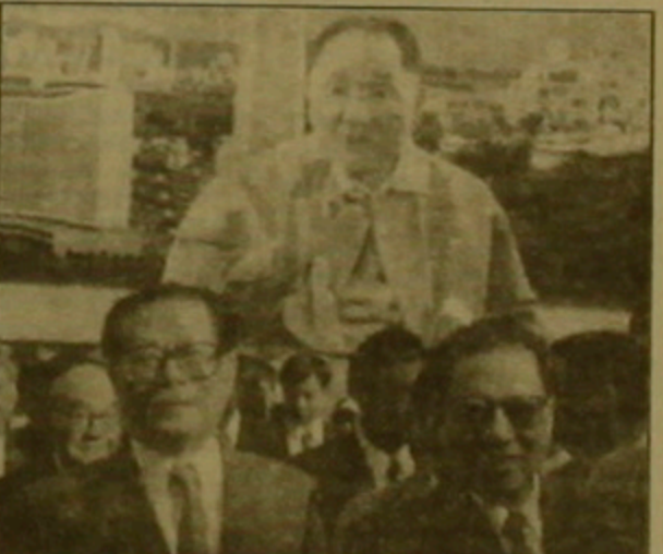
«Մեծ արեավան» երկրի անհայտ արձակումն արդեն իսկ վաս նախանշաններ են համարում Չինաստանի աղյազայի համար: Պասրասեց ՊԵՏՐՎԱՐ ԵՎՐՈՊԱ

համարում է չափազանց հոռեստական: Բայց սնահավաս լինելով, նրան հունվարի 17-ին ճաղորդականում տեղի անցած ուժեղ երկրաշարժը և հունվարի 26-ին չինական