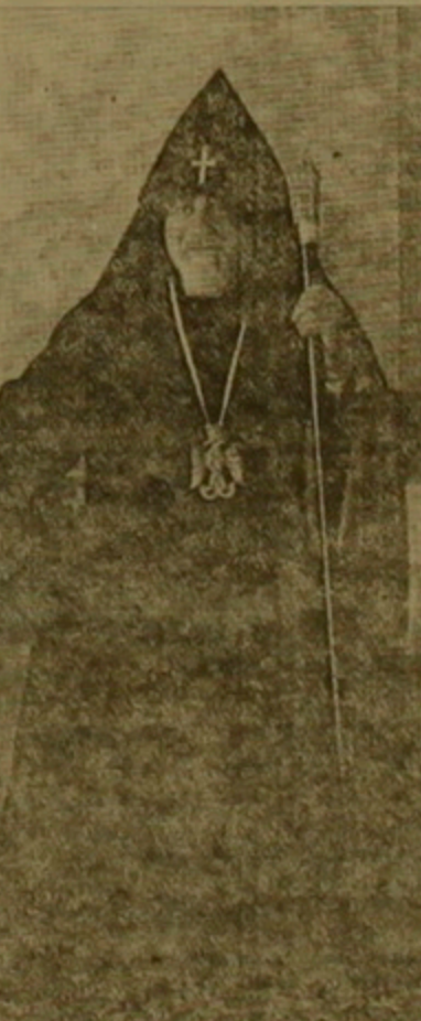
Նորոգութեան այդ հրանայական ներքեւ, և առաջին ներքում նայում են ին մեջ: Հարց են տալիս ևս ինն, Ո՞ր կի, և ի՞նչ կի սրանից մէկ տարի առաջ, և ո՞ր են երկ նր կոմ այսօր, 1996 շեմին: Անա ինն ամիսներ ասիւնցին անցնող տարւոյ ընթացում որ ևս շեղելի, աղբնի և գործելի իմ հայրենական հողի վրայ, մեր բոլորի կոյմից Արարիկի Արցոց ճանաչումը Հոգեւոր այս տան Ս. Էջմիածնի հոգեվարում, ին ունելի վրայ շալակով Հայաստանայց եկեղեցու առաջին ստրատորի ծանրագոյն կարծիքներ, մեր դասնութեան այս շրջադարձային հանգրուանում:

Իմ հայրական խօսքն են ուղղում առաջին ներքին իմ հոգեւորական կրօնն եղբայրներին եղիսկոյոս, վարդապետ, բանահայ, ստղկաւագ ստրատորներին: Աննայն Հայոց Կարողիկութեան Մայր Աթոռ իր հոգեւոր և ազգային դասնական ամմեկուրի նր ունելուցնելու և արդի նաւուելու համար կարլին ունի մեր բոլորի ամբողջական, անվերապահ և անձնագրողական նախաբերման: Եղբայրներ, եկէլ լի նենն հոտուարի մեր եկեղեցականի խելակոյ ինն նորութեանը: Ի՞նչ գեղեցիկ բառ է հոգեւորական բարբայրներին հոգիի մարդ Աստուծոյ Հոգիին ճառագայրները գողացնող մարդ: Մեր եկեղեցու վարդապետի սրբախօս երբեքից արսաւանումը բառերով լինեն «ար», որդեկազմ մեր կեանք խօսքը կարողանայ համ տալ մեր հաստատեցնելու կեանքին, լինեն «դոյ», որդեկազմ կարողանան լուսաւորի մարդկանց կեանքի ճանաղաւոր (Տեւ ԱՄՏԹ, է 13-16): Թող վերանորոգութեան շուրջ մեզինց սկի: