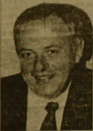
դու ժամ ունեցող» նախագահ Ելցինին ճնային դայանոնում հանդիպելուց հետո: Հեռուստատեսության հարցին «Ի՞նչ մտնում եմ նախարարի դրաստոնում», Անդրեյ Կոզիրեյը անվարան դրաստոնեց «Այո, մտնում եմ»: Իսկ թե ինչպես ուղիս համաստեղի արագորձնախարարի և Պետրոսյանի դրաստոնակների կասարումը, բողոքեց. «Կենտրոնական ընտրական հանձնաժողովի նախագահ Ռայսը վի հայեցողությունը, «որն ավելի լավ գիտի այդ միջանկյունները» վրածես թե Սահմանադրություն չկա և սահմանադրություն չի կանոնակարգվում սկսել խնդիր»:

Կուսակցությունը ներկայացնող վարչապետը անհատապես հրատարակում էր, ինչպես այդ արեց, օրինակ, նույնիսկ Թուրքիայի վարչապետ Թանուր Չիլլերը, թեև նա դեկավարում «նեմարիս ուլի» կուսակցությունը ընդամենը 2 տոկոսով էր զիջել Էրբանի «Բարոսյանը»: Մակայն ՌԳ վարչապետ Վիկտոր Չեռոմոխիցիի մեծով անգամ չի անցնում հետեւ այս օրինակին, չնայած նա դեկավարում «Մեր տներ Ռուսաստանն է» բառերը համայնավարների 22 տոկոս ձայների դիմաց հավանել է ընդամենը 9.6-ը: Չի անցնում, որովհետև, ինչպես վարչապետ նեւ Կիմ, վարչապետ առաջադրելու իրավունքը բացառապես երկրի նախագահի սահմանադրական մեծաճանաչ է, իսկ վերջինս կարող է կասարելադրել անհետ ընտրության արդյունքները, մասնավորապես, ինչպես իրեն խոսուվանների երբաբար, որ դրաստոնակ անելու վստահ չկա: