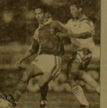
Կիս Բորի Չարչոնը, որոշեց եվրոպական 25 երկրների լավագույն ֆուտբոլիստներին:

Ռուսալուսայում դեպ է նեղ, որ Ֆրանսիայում լավագույն ֆուտբոլիստ է ճանաչվել հայազգի Յուրի Ջորկանֆր, որը գերազանց անցկացրեց 1995 թ. ֆուտբոլային մրցաբարները: