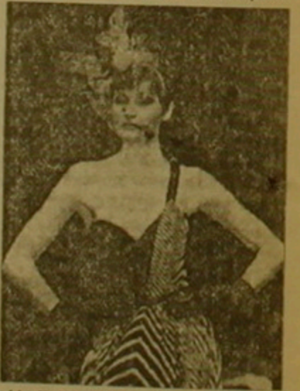
Ֆոտոմու Ներկայացված իր նոր գաղափարները հայնամատային հավաքածուի մեջ նորածնություն կերտողներից մեկը Գրեյս Փիրը, ընդհանուր դուռն է առիթն

Գրեյս Փիրը, շոտլանդացի կոմպոզիտոր և երգչուհի էր: