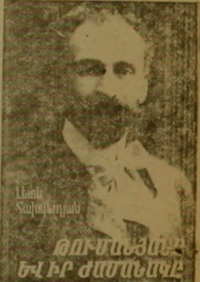
Հրանտ Ավակյանի «Թումանյանը եւ իր ժամանակը» գիրքը

«Ոչ մի հայ գրող իր կյանքը չի դասնել ավելի լավ, քան Թումանյանը: Բայց նրա կյանքի դասնությունը սվայները գրված են իր բովանդակ ստեղծագործության մեջ՝ զեղարվեստական երկեր, հոդվածներ, նամակներ, գրառումներ: Իմ իսկ դիրք այդ ամենի համարումն ու համակարգումն է եղել ըստ Թումանյանի կյանքի ժամանակագրության եւ ընթացիկ»: