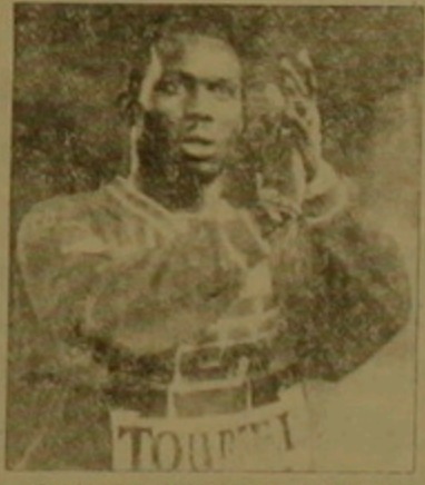
Ժորժ Վեա (Լիբերիա, «Միլան»), հարձակվող

«Միլանի» եւ Լիբերիայի հավաքականի հարձակվող Ժորժ Ասան արդեն 2 անգամ ճանաչվել է Աֆրիկայի լավագույն խոսքովիս: Նա յոթնեան հավակնում է նաև Եվրոպայի լավագույն խոսքովիսի շիտոսին, Բանի որ առաջին անգամ «Ֆրանս խոսքովի» բուլլասել է իր մրցույթի մասնակցներին նեկ նաև ոչ եվրոպացի խոսքովիսներին: Ժորժ Ասան, Չեմպիոնների լիգայի նախտող խաղարկության գլխավոր ուղարկուն է (7 գնդակ):