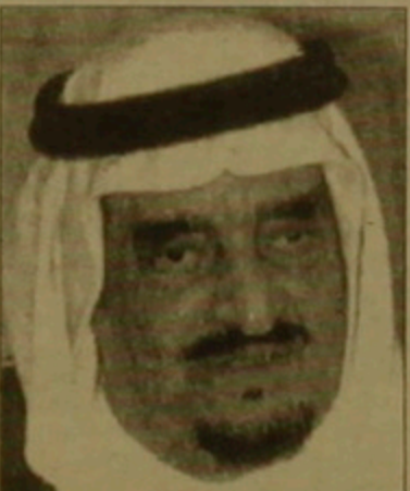
Մաուդյան Արաբիայի թագավոր Գալիբ Աբդուլազիզը:

Գին: Իսկ ամենակարեւորը՝ ցուցեցին բոլոր դաժնադրողները, որ Մաուդյան Արաբիայի մայրաքաղաքը զերծ է ահաբեկչական հարձակումներից: Ամերիկացի և սաուդյան անվան զուլուր աշխատակիցները, 73 թի մասնագետների աշակերտությամբ, հեռանում են ծավալել դաժնադրող թայրությունի դաժնադրողները, և լնայած սկզբնական քաղաքում դաժնադրող նախադրողները կարծես թե ընկնում էր նախկինում անհայտ երեւ միջինարեւելյան խմբավորումների վրա, հետո գայում դրանք հերկվեցին և կասկածները դարձյալ կենտրոնացան «ավանդական թեմանիներին»: Իրանի, Իրաֆի և Սուդանի վրա, որոնք ուրախ դիտել լինեին սասանելու Մաուդյան սան հիմները: