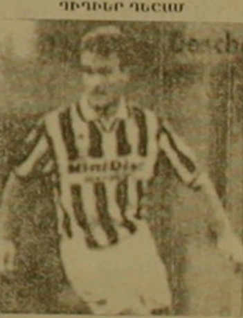
Կիսակեսակից խաղացողը («Յուվենտուս», Ֆրանսիա): Ծնվել է 1968 թ. հոկտեմբերի 15-ին: 1995 թ. Իսպանիայի Չեմոլոնների լիգայի խաղադրույթներում է ընտրվել 1995-1996 թթ. ՌԻՖՖԱ-ի գավաթի խաղադրույթներում: Ֆրանսիայի հավանական խաղացող է: