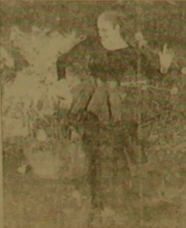
Մայա Պլիսեցկայանը հասկանալի այդ երեկոյի արդյունքով Պլիսեցկայայի համար թե

Բալեթի աշխարհահռչակ դարուհի Մայա Պլիսեցկայան 70 տարեկան է, բայց 37 ամյա կնոջ տղալուրություն է բող նում: Ամուսնու կոմպոզիտոր Ռոդոլֆ Էշեղիանի հետ մեղադրանք ավելի ասա ստորում է Գերմանիայում, ասա Ռուսաստանում: