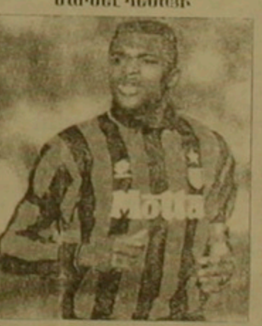
Կիսակեսակից խաղացողը («Սիլվան», Ֆրանսիա): Ծնվել է 1968 թ. սեպտեմբերի 7-ին: 1995 թ. Չեմոլոնների լիգայի մրցակցային խաղադրույթներում է ընտրվել 1995-1996 թթ. ՌԻՖՖԱ-ի գավաթի խաղադրույթներում: Ֆրանսիայի հավանական խաղացող է:

50-ի թվում են 8 իսպանացի, 5 գերմանացի, 5 ֆրանսիացի, 4 քաղաքացի, 4 արգենտինացի, 4 հոլանդացի, 2 դանիացի և այլն: