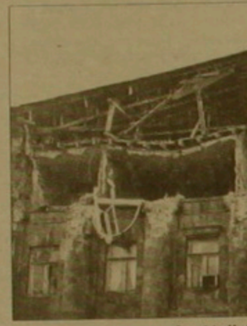
Գյումրի Աղետի աղետի տների շինարարության հետ

1995 թ. հունիսի 30 ի դրությամբ մասնավոր է 2 մլն. 569 հազար 630 դոլլար, 46 ցենտ: