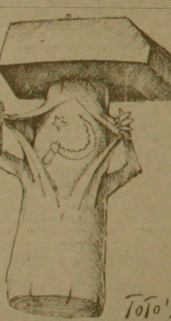
Մեր կուսակցությունն ունի իր երկին խնդիրները, որոնց շուրջ սարքեր մտնեցումներ կան։ Ցավով, այդ խնդիրները վերածվել են արժանապատիվական երեւոյթի եւ ամենաբարձր թերթեր («Ռեսուրսիվիկա Մոմենտալ», «Առաջիկա») հրատարակում են նյութեր, որոնք չեն համապատասխանում իրականությանը։ Եւ համաձայն չեն այն կարծիքին, որ մեր կուսակցության մեջ այդպիսի ճգնաժամ կա։

Պենտոնի որոշումը ժամանակին հանձնվել է «Մեր խոսքը» թերթին։ Ինչո՞ւն են երեւում է, օրյեկտիվ, քա հարգազու խոսակցությունը բարձրացված հարցերի շուրջ, ըստ էության, ձեռնու չէր նրանց։ Այլապես ստիպված կլինեին դասախոսները այնպիսի հարցերի, ինչ թե՛ս, ոչ ինչու է ինչու՞ վիճեցրեց կառուցողական ձախ, սոցիալիստական կողմնորոշում ունեցող ուժերի բոլորի ձեւավորումը հայաստանում, թե՛ս «Կոմկուսը ընտրությունների կրճատման միջոցով»։ Փոխարենը փորձեցին կենտրոնից գաղտնի աղանակներ գործարկելու գնալ հակակոմունիստական ծայրահեղ բերքներ կազմակերպող ուժերի հետ։ Կամ, ոչ ինչու է միայն միեւնույն ընտրության ճգնաժամը հավանաբար երկու, երեւել կոմունիստ դասազատության քննադատներին։