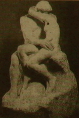
Ռոզնե «Համրոլը» Ալանճարիլիսներն Յակոբսի նաւնճանալիս լինի հեխարհում: Նա սիում է ճանաչված գործեր, հուկարճաններ, սարկոֆաղներ: Յակոբսը Եւրոպայի եւ Գոսրենիս դասկիրում է «նճաճ արկայարուսերի», երկու հանդակ, իսկ Պուղ Գուղոսակի միւրճալ Մոնեզո մեթիլի հեճոլ արճան: Իր սանը մի ճարտրագործներն ու երեկայիներ կազմակերպելուց հեճո նա կողմնակնրելում կատուցում է մի ճու ու փառաեղ արվեստի դալալ (Glyptotek) եւ արկալե ճեղեղով հալարական ճեռնային այլի

Միլեի, Բուղոյի մի կանի կսակներից ճաւ, ճեղեղակարությունը Կաղարեղ Յակոբսի յեր հեխարհում (ալաճ ճ, նա եւս կանի ուլ կազմեց իմրեխիոնիս նկարիների մի փայլուն հալարանուն: Կողմնակնրելի ճանճարանում միայն Պուղ Գուղոնի գործերից կա 33 կան, անճոճ, նրա դանիացի կնոջ Մեճեթի աղեղոլության ճնրիլով: Հալարանունի մեջ են նաեւ Գուղոսակ Կարբի «Երեկ քաղիկ անճուլիներ դաստահանի մոտ», Էդուար Մանեի «Ալեքեթ խոնոլը», Կող Մոնեի «Կիսուններնեւ Բորիզեւայում», «Բճան ժան Մոնե», Էդուար Դեղայի «Գուղոլական փողոց», Վիկտոր վան Գոգի «Ցորենի արճ լեռան ֆոնի վրա» կսակները եւ բազմաթիվ այլ գործեր: ՊԱՐճԱՍՏԱԿ ՊԵՐճԱՍՏԱԿ