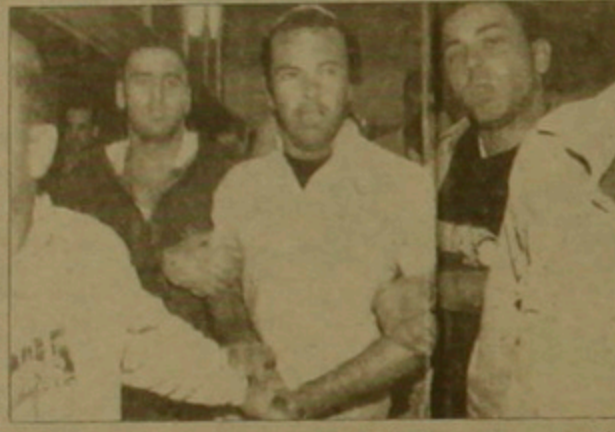
Շարակի գործակալ Ավիլիար Ռավիլիի հետ Ռաֆինի հանդիպումը:

հիշում են, Իսրայելի վարչապետ Յիցիակ Ռաֆինը հենց այդդիսի դրսի է աղանվել, երբ Թեյ Ավիլիում սեղի ունեցած հանրահավառն էլուր ունենալուց հետո դեղի իր մեկնան է ողղվել: Ավիլի զարմանալի բանը էլ են դարզվել: Համաձայն ողանի, այդ ճարտաչակ րելավիվան հանրահավառի հարակից որեիցե բարձրաստիճան մասնակցի հեռանալու դահին ոսիկանությունը անվանագրության ծառայությունից այդ մասին հասուկ ազդանքան է սացել: Միայն մի անգամ ոսիկանությունն այդդիսի ազդանքան չի սացել: Դա եղել է վարչապետ Ռաֆինի հեռանալու դեղում: Բացի այդ, ոսիկանությանը հրաման չի սղվել, որ կողմնակի